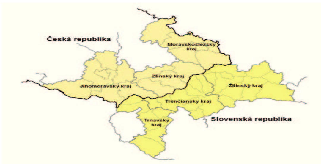
Obrázek 2.2: Mapa dotovaného území

a slovenských projektů 20 . Finanční podpora z EU pokrývala až 75 % z celkových způsobilých výdajů projektu, a podpora z veřejných zdrojů ČR, kdy minimální spolufinancování činí 25 % včetně státního rozpočtu (max. podíl je 5%). [33]