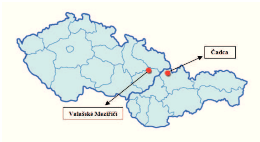
Obrázek 3.2: Poloha měst Valašské Meziříčí a Čadca

Jednou z nejdůležitějších spojitostí je skutečnost, že se rozprostírají obě města na úpatí Beskyd, kdy Valašské Meziříčí představuje vstupní bránu do pohoří Moravskoslezských Beskyd a na východní straně pohoří, obrazně řečeno, otvírá tuto bránu město Čadca. Společné úsilí o zachování této krajiny a zvyšování potenciálu udržitelného cestovního ruchu je jedním z hlavních bodů náplně dlouhodobé spolupráce, která probíhá od 90. let minulého století. Hlavní předností je vzdálenost mezi městy (viz Obrázek 3.2). Tato skutečnost usnadňuje partnerskou spolupráci měst. Obě města mají bohatou historii, tradici a kulturní zázemí. Čadca je také významný dopravní uzel, který Slovensko přibližuje k České republice a dále také k Polsku. [31]