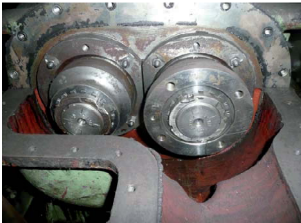
Obrázek 2: Šroubový kompresor GHH bez zapouzdření