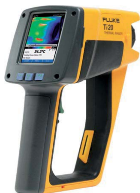
Obrázek 4: Termokamera Fluke Ti 20