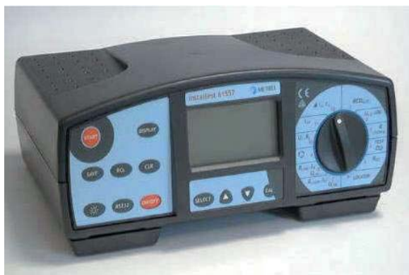
Obrázek 5: Instaltest 61557

Naměřené hodnoty horkého povrchu elektromotoru můžeme vidět na obrázku 6.