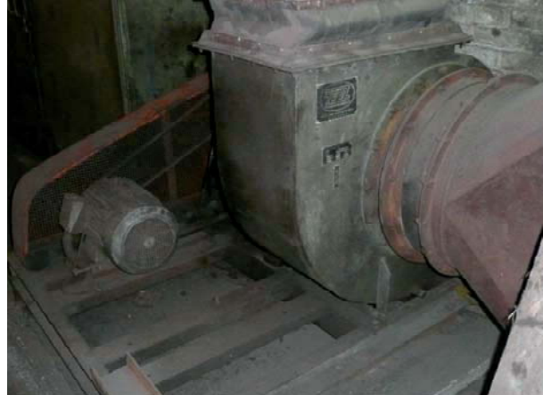
Obrázek 3: Ventilátor zajišťující výměnu vzduchu