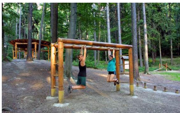
Obr. 4.1 – Stezka zdraví Tlustá hora

Tato stezka zdraví leží na pozemcích městských lesů pod Tlustou horou, umožňuje návštěvníkům řadu možností aktivního využití volného času jako běh, cykloturistika, dětské hry, posilování, rozcvičení, rodinné výlety a vycházky. K jádrovému území stezky zdraví vede hned několik označených přístupových tras, jedna vede z Letné - ulicí Pod Rozhlednou, druhá ze čtvrti Pod Majákem, třetí trasa vede z Prštného ulicí Nerudova a čtvrtá, poslední, vede z Podhoří od ulice U Slanice. Návštěvníkům pomáhají k orientaci informační tabule. V lese na jádrovém území se nalézají atypický lesní altán, lanová visutá lávka a dalších pět stanovišť se cvičebními prvky jako jsou hrazdy, bradla, žebřiny, skluzavka, dětská hopsadla a další podobné atrakce.