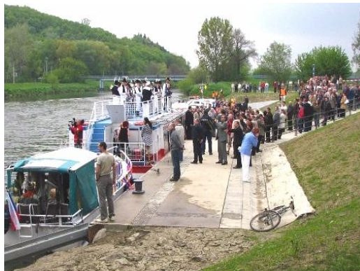
Obr. 4.10 – Baťův kanál – přístaviště Otrokovice

Podél trasy Baťova kanálu je 9 pevných sjezdů do vody s různými rozměry. Sjezdy na řece nemusí být vždy upraveny, a proto mohou být zaneseny bahnem. Z tohoto důvodu se doporučuje využívat sjezdy, které jsou v přístavech a jsou udržovány. Navíc je zde možnost hlídání automobilu.