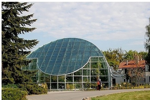
Obr. 4.6 – Zoologická zahrada Zlín-Lešná

Po válce v roce 1945 došlo k zestátnění celého zámeckého areálu, ale zavřený byl jen 3 roky a v roce 1948 byla ZOO-Lešná oficiálně otevřena pro širokou veřejnost. V 60. letech zoo proslavil hlavně chov exotických bažantů a běžců emu. Mezi nejvýznamnější stavby tohoto období patří pavilon primátů a pavilon exotických zvířat. 70.- 80. léta byla ve znamení významného rozšíření druhů chovaných zvířat (například nosorožci, buvolci, šimpanzi, lední medvědi). Kvalita a estetické provedení výběhů pro zvířata však byla na velmi nízké úrovni, ale areál naštěstí nezničily různé velkolepé "socialistické" stavby. V 90. letech bylo zahájeno budování kvalitní a moderní zoo, kde se měly nacházet ekologické stavby k ochraně prostředí, modernizovaly se inženýrské sítě. Dále probíhala základní obnova zámeckého parku, stavební rekonstrukce pláště zámku, kompletování zámeckých sbírek, a také se zde uskutečňovaly první svatební obřady na zámku Lešná.