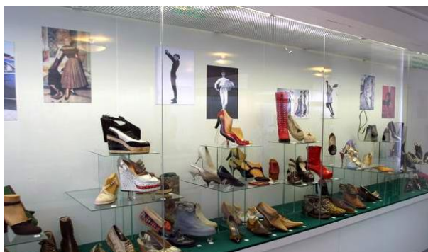
Obr. 4.7 – Obuvnické muzeum

Stálá expozice ze sbírek Muzea jihovýchodní Moravy se nachází v bývalé hlavní bráně průmyslového areálu Svit v centru města. Návštěvníci se mohou seznámit s historií i současností obouvání, průběhem vývoje výroby obuvi a dějinami ševcovského řemesla jako takového, prostřednictvím více než tisíce exponátů, které se zde nachází. Sbírka se zaměřuje na vývoj obouvání od nejstarších dob českých dějin až po současnost. Nejranější období je zde ukázáno pomocí replik starodávných exponátů. Nejstarší originály pocházejí až z konce 16. století.