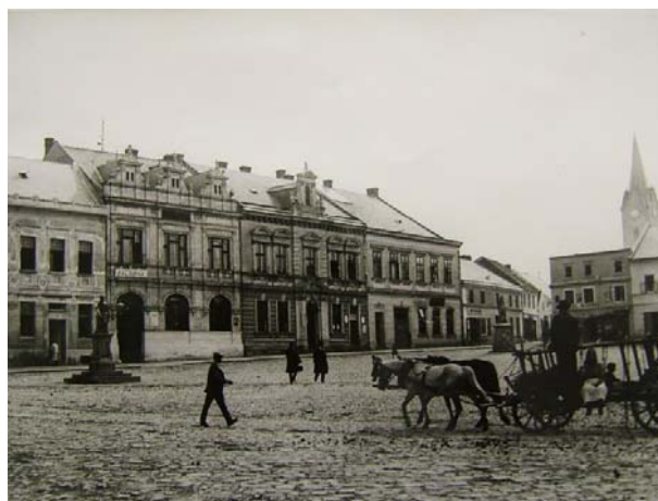
Obr. 3.1 – Historický Zlín

Další archeologické pozůstatky dokládají existenci tvrze již ve druhé polovině 15. století. Stavba se nacházela dole ve městě na místě dnešního zámku, který svou renesanční podobu získal v 16. století. V dnešní podobě je zámek čtyřkřídlová budova s uzavřeným nádvořím.