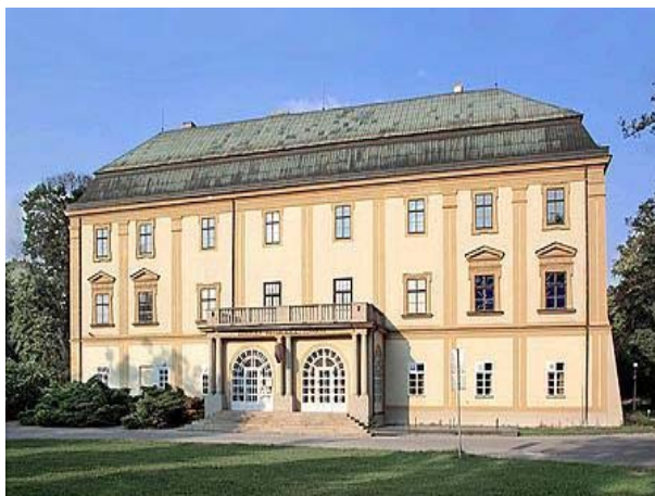
Obr. 4.5 – zámek Zlín