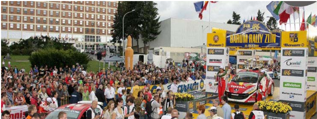
Obr. 4.8 – Barum Rally

a Maják vzrůstal i počet těžkých rychlostních zkoušek v okolí Kašavy a vznikala obtížná vsetínská sekce. Jedinečný šarm klasické barumky tvořila její atmosféra nočních průjezdů na Kopné, pod malenovickým hradem nebo průjezd přes Pindulu, které okouzly jak diváky, tak samotné jezdce.