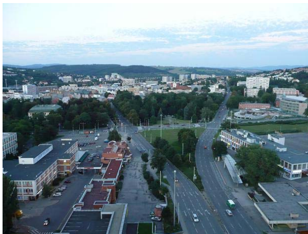
Obr. 3.2 – současný Zlín

Obchodní a kulturní centrum se nachází kolem obou náměstí (náměstí Míru a náměstí Práce) a také mezi nimi. V této lokalitě se nachází celá řada obchodů. Na náměstí Práce najdeme Velké kino, Obchodní dům a tržnici Golem, nedaleko je situován hotel Moskva a na kopci nad náměstím najdeme Dům umění, kde sídlí i filharmonie Bohuslava Martinů. V oblasti mezi náměstími najdeme mimo obchodů a dalších zařízení také dva parky (sad Komenského a sad Svobody), kde se konávají nejrůznější společenské akce zaměřené především na mládež a děti. Na náměstí Míru najdeme obchodní středisko Zlaté Jablko, dále na budovu radnice Magistrátu města Zlína a hlavní poštu. V blízkosti náměstí se nachází budova Městského divadla a také kostel svatého Filipa a Jakuba.