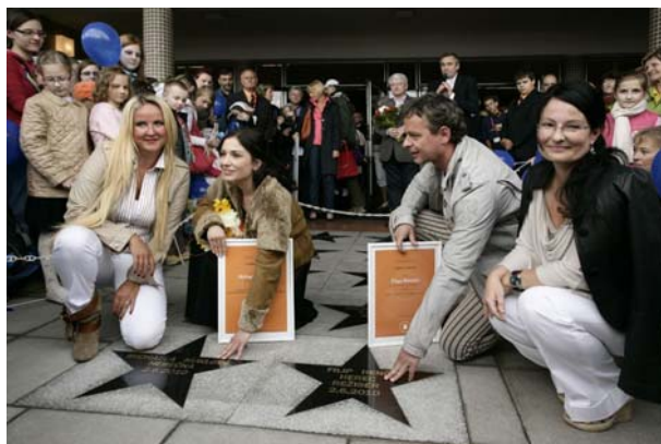
Obr. 4. 9 – Filmový festival-chodník slávy

Filmy se ve Zlíně nejen promítají, ale i natáčejí. To už od roku 1936 kdy Jan Antonín Baťa založil ve Zlíně filmové studio, které se během let stalo nejvýznamnějším střediskem tvorby filmů pro děti a mládež v Československu. Ve zlínských ateliérech působili věhlasní tvůrci filmů jako Karel Zeman (tvůrce filmů jako Cesta do pravěku nebo Vynález zkázy), Hermína Týrlová (nejznámější díla Ferda Mravenec nebo Vzpoura hraček), Alexander Hackenschmied (z jeho materiálu vznikla díla jako Chudí lidé, Řeka života a smrti nebo Vzpomínka na ráj), Břetislav Pojar (podílel se na legendárním animovaném seriálu Pojdte pane, budeme si hrát nebo na příběhu podle Trnkovy knihy Zahrada) anebo Josef Pinkava (scénář a režie u filmu Metráček). Slavná filmařská tradice žije ve Zlíně dodnes a pokračuje na dvou filmových školách. Právě takové spojení filmové a filmařské tradice dodává zlínskému festivalu na jedinečnosti. A také díky této jedinečné historii dochází každoročně k propojení dvou stran filmového světa, a to diváckého a tvůrčího.