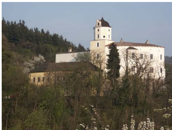
Obr. 4.2 – hrad Malenovice

V jeho vlastnictví se prostřídala celá řada šlechtických rodů (například Tetourové z Tetova, Lichtenštejn - Kastelkornové, Salm - Neuburkové), posledními majiteli byli Šternberkové, kteří zde sídlili mezi roky 1804-1945. Od roku 1953 přešel hrad do státního vlastnictví a získalo jej tehdejší krajské muzeum, dnes to je Muzeum jihovýchodní Moravy ve Zlíně. Část hradu je zpřístupněná veřejnosti. Návštěvníci se mohou seznámit s některými hradními interiéry (například malovaný sál s pozdně gotickou klenbou a dobovými nápisy z první poloviny 16. století, domácí kaple s malbami z poloviny 18. století a jiné).