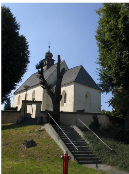
Obr. 4.4 - Kostel sv. Jakuba Většího v Tečovicích

Tato sakrální stavba stojí jistě za zmínku jako jedna z duchovních památek v okolí Zlína, a to především díky svému stáří, které se odhaduje na období kolem roku 1260. Kostel je umístěn na kopečku v Tečovicích, obec ležící mezi Zlínem a Otrokovicemi. Původní stavba byla postavena v románském stylu, ale později byl kostelík přestavěn do stylu barokního. Z historického hlediska se jedná o skutečný unikát, i když v současnosti již nevzbuzuje takovou pozornost mezi historiky, jako tomu bylo v minulosti. Kostelík je orientován na východ a tvoří jej loď a sakristie. Také je obklopen malým hřbitovem, jak již tomu bývalo za starých časů u většiny staveb tohoto typu. Kostel je jednopatrový a není zde sklepení. Okna tvoří lomený oblouk. Asi největší pozornost si zaslouží původní nástěnné malby, které by podle odhadů mohly být staré až 700 let. Tyto malby