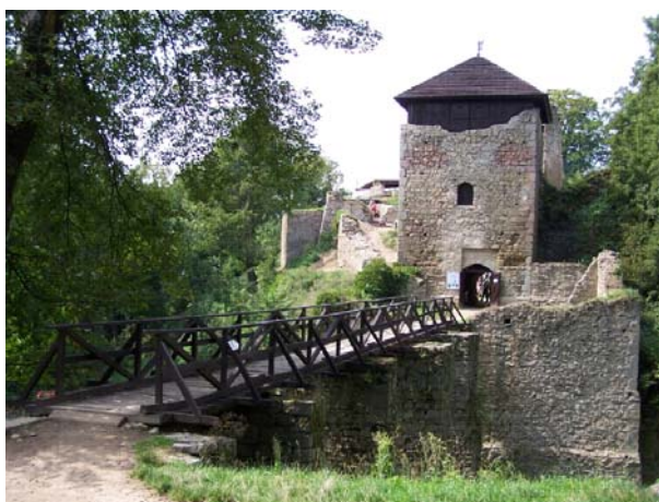
Obr. 4.3 – hrad Lukov

Hrad byl s největší pravděpodobností založen na počátku 13. století na jednom z dominantních vrcholů jednoho z kopců Hostýnských vrchů na ochranu moravsko – uherského pomezí. Založení hradu je spojeno s upevňováním královské moci v tomto regionu. O jeho významu svědčí, že se na jeho výstavbě zúčastnili i kameníci, kteří pracovali na výzdobě stavby kláštera ve Velehradě.