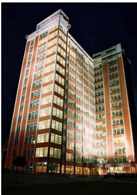
Obr. 4.11 – 21. správní budova

Baťa, kde sídlili ředitelé jako Čipera, Hoza, Udržal nebo Hlavnička. Dnes jsou od 9. do 15. podlaží kanceláře, které slouží krajskému úřadu. Od 4. do 8. jsou prostory finančního úřadu. Ve třetí etáži nalezneme veřejnosti přístupnou restauraci, a ve druhém podlaží nalezneme výstavu o historii baťovského podnikání. Pro širokou veřejnost je velkým lákadlem především kavárna v 16. podlaží, ze které se naskýtá ohromující pohled na město Zlín. Dnes jsou v budově 4 rychlovýtahy a jeden páternoster.