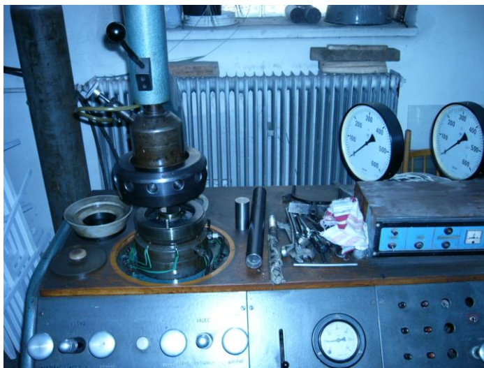
Obr. 1 Nepravý triaxiál T-500

Skúšky na nepravom triaxiálnom prístroji T – 500A sa realizovali na skúšobných telesách valcového tvaru. Bolo odskúšaných 6 vzoriek magnezitu s rovnakými rozmermi :