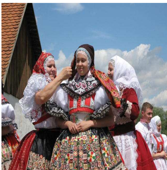
Obr.č.23- Vázání šátku

tradice lidové kultury v současnosti. Vycházejí z hudebních tradic strážnického i blízkých etnografických regionů vytvořil svůj vlastní osobitý styl, který se díky jeho osobnosti dostal do obecného povědomí jako "strážnický styl". Svě znalosti hudební lidové kultury i praktické muzikantské zkušenosti se Volavý pokusil vícekrát formulovat. Ať to bylo v přednáškách na vědeckých konferencích a odborných seminářích, nebo v proslovech na metodických soustředěních souborů. Vždy kladl důraz na poznání podstaty folkloru, na jeho prožitky.