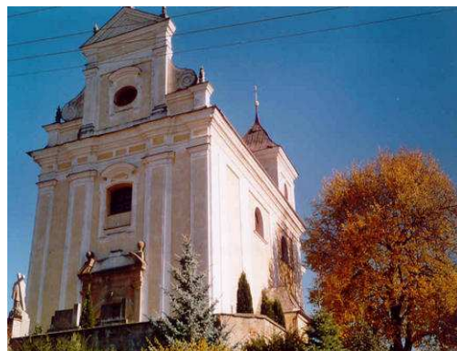
Obr.č. 9 - Kostel Obrácení sv. Pavla (internet-5)