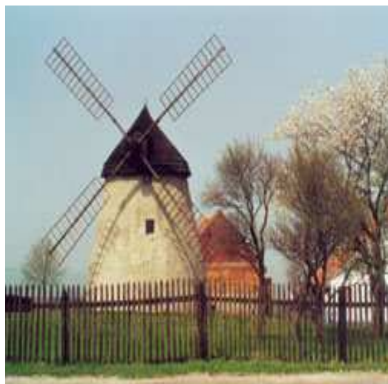
Obr. č. 28- Exteriér mlýna (internet-16)