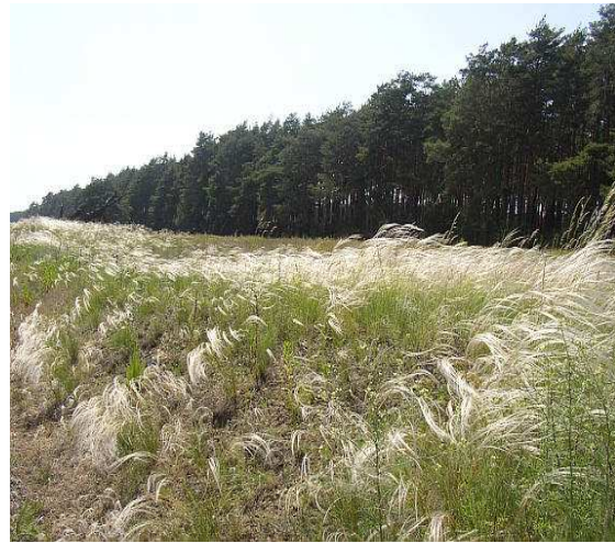
Obr.č. 18- Váté písky s kavylem písečným (internet-12)