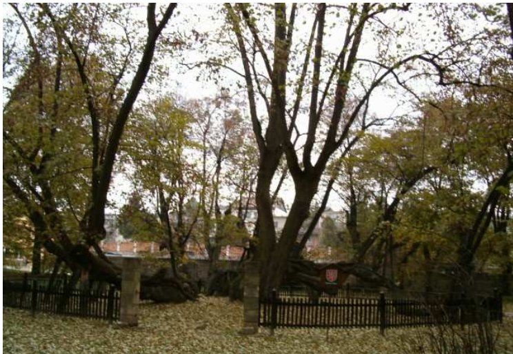
Obr.č. 7- Bzenecká lípa