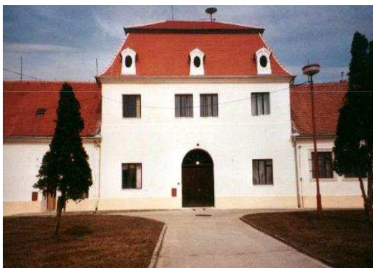
Obr.č. 8 -Domanínský dvůr (internet-3)