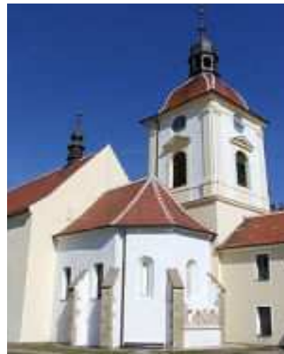
Obr.č. 11- Kostel sv. Vavřince (internet-7)