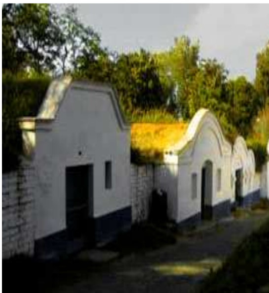
Obr.č .25- Typické stříšky vinných sklepů (internet-15)

modré barvy a ornamenty vinné révy po stranách, nad okny a nad vchodem. Každé průčelí je specifické, tvořené jedinečnými tvary a oblouky. Vnitřní místnosti mají ve stěně větrací otvor. Chodby se svažují směrem dolů. Na začátku bývá lisovna, na konci místnost, kde se skladuje víno. První místnost často slouží také k posezení. Vinné sklepy v Plžích vytvářejí uličky, které se spojují dvě centra. Horním centrum je středověkým bodem různých akcí, které se během roku v Plžích pořádají.