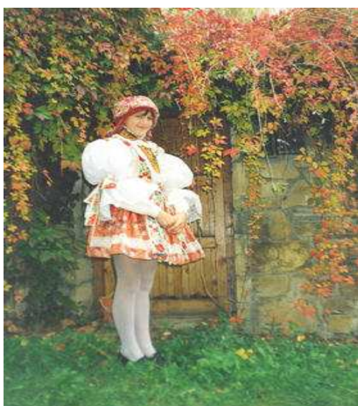
Obr.č. 2 - Místní kroj (internet-5)

Děvčata nosí k slavnostnímu kroji černou sukni, fěrtůšek (brokátový, ornátový, dříve též harasový) a rukávce s baňatými rukávy nad lokty s nařasenými kadrly - to jsou strojově vyšívané krajky nebo vyšívané ručně - tzv. kvelbování. Vyšívání na ramenech, na prsou a límec u krku jsou nejkrásnější ozdoba slavnostního kroje, rovnajíc se drahocennému šperku. Kordulka je zdobená stříbrnou portou a slováckou mašlí. Na hlavě turecký šátek uvázaný kolem hlavy a kolem pasu a na rukávcích uvázané slovácké pentle.