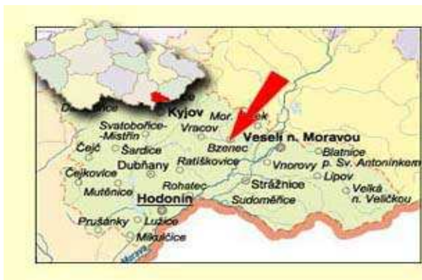
Obr.č 1- situační plánec,(internet-1)

Ke vzniku Mikroregionu Bzenecko došlo na ustavujícím zasedání starostů zakládajících obcí Bzenec, Domanín, Moravský Písek, Surovín, Těmice, Vracov a Žeravice dne 26.6.2002 ve Bzenci, který se také stal sídlem tohoto dobrovolného sdružení obcí.