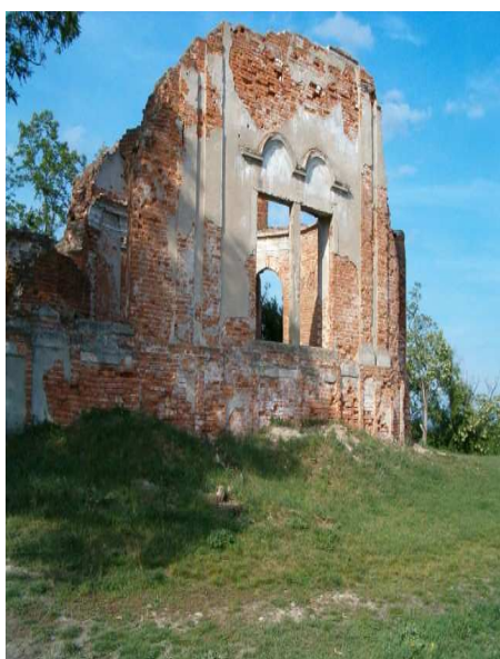
Obr.č.19- Bzenecký hrad (internet-13)

byl střediskem hradeckých úřadů, které byly dříve v Břeclavi a koncem 13. století ve Vracově. Roku 1435 se uvádí jako pustý a roku 1491 jako zbořeniště. Na vrcholu kopce zůstala z hradu oválného půdorysu patrná pouze terénní vyvýšenina. Beze zbytku zmizelo nepovrchové zdivo, které bylo v průběhu doby zřejmě čile rozebíráno našimi aktivními předky pro stavební účely. Po původním hradním areálu, orientovaném delší osou přibližně ve směru západ-východ, zůstal v terénu obdélníkový půdorys, zřejmý z leteckých snímků. Uprostřed tohoto areálu se dnes tyčí zbytky kaple sv. Floriána, která byla v roce 1945 zničena ustupující německou armádou. Ze severovýchodu obepíná lokalitu koryto vyschlého potoka, k hradnímu jádru přiléhá zbytek původního předhradí. Archeologický materiál nalezený spíše náhodně na této lokalitě je vesměs do 14. a 15. století. Po hradu, který se dříve nacházel na vrcholu kopce nad Bzencem, dnes není tedy dochována téměř žádná stopa, jeho existenci dokládá pouze název kopce.