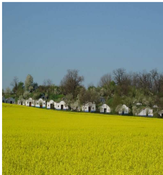
Obr. č. 26- Areál vinných sklepů (internet-15)