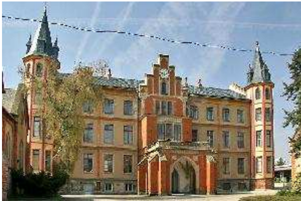
Obr.č 5 - Hlavní průčelí (vlastní dokumentace)