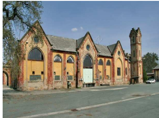
Obr.č. 6- Hospodářské budovy (vlastní dokumentace)