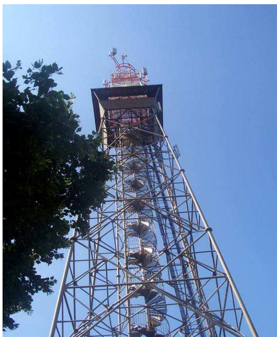
Obr.č. 29 - Rozhledna Travičná

Rozhledna je postavena v katastrálním území obce Tvarožná Lhota, v lokalitě známé jako Vrchy. Na mapě ji lze najít pod názvem Travičná, což je vrchol kopce s nadmořskou výškou 380metrů. Je první rozhlednou v chráněné krajinné oblasti Bílé Karpaty. Pohled z rozhledny jihozápadním směrem přes Hodonín začíná na hřebeny Pálavy, pokračuje přes severozápad dlouhou hradbou Ždánického lesa a Chřibů. Zde nelze přehlédnout známý hrad Buchlov se sousedící kaplí sv. Barbory. Dále na sever jsou vidět jezera u Ostrožské Nové Vsi a směrem přes Veselí nad Moravou jde pohled dále za Uherské Hradiště až k Hostýnu. Na severovýchodní straně návštěvníka může zaujmout proslavené poutní místo - Svatý Antoníček u Blatnice a dále na obzoru je vidět hřeben Vizovických vrchů. Zbytek pohledu zaujmají Bílé Karpaty, kterým dominuje nejvyšší vrchol 970 metrů - Velká Javořina. ( internet-17 )