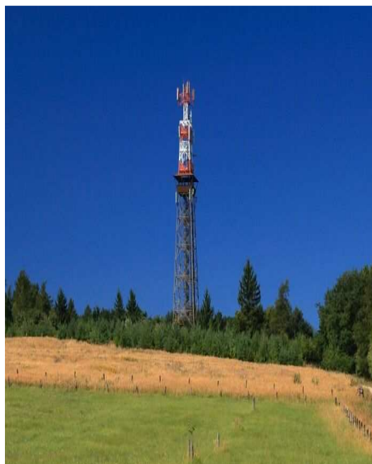
Obr.č. 30- Rozhledna Travičná s okolím