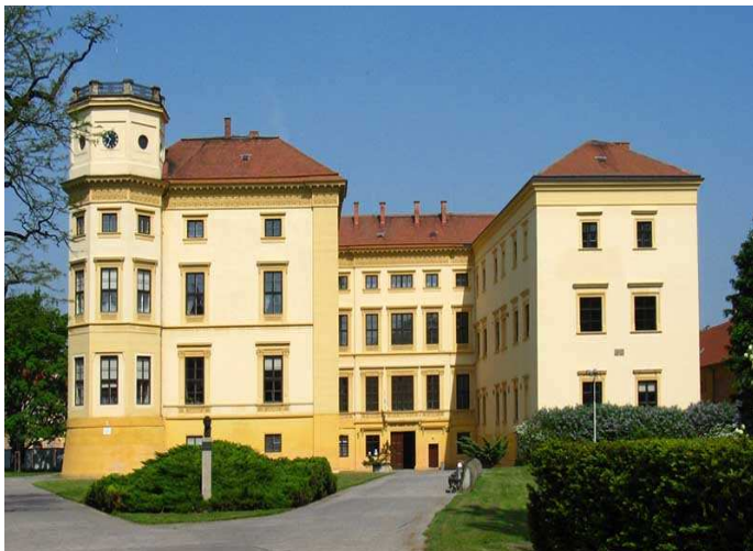
Obr.č. 10- Strážnický zámek (internet-9)

Od 19. stol. je v renesanční podobě. Posledními majiteli byli hrabata Magnisové. Nyní je majitelem zámku stát. Nachází se v něm muzeum s expozicí lidové keramik, hudebních nástrojů, sbírka obrazů a knihovna. V okolí zámku je anglický park založený v I. polovině 19. století. ( internet-9 )