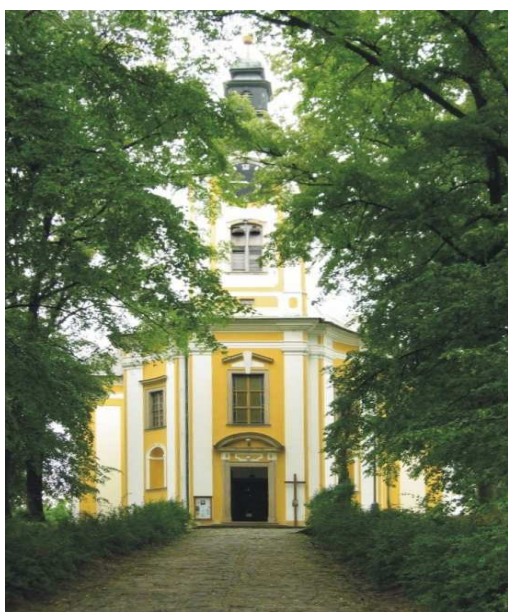
Obr.č.13- Kostel Stětí sv. Jana Křtitele (internet-8)

tovaryšem prozrazen a musel z ukradeného materiálu ulít ještě malý zvon, který byl zavěšen na radniční věž. Zvon na malou věž kostela věnoval Zikmund z Petřsvaldu. Při velkém požáru Žeravic v roce 1775 vyhořel i kostel. Zvony se žářem roztavily a znovu byly přelity v roce 1776. Do kostela byl přemístěn již zmíněný zvon z radnice. Interiér kostela byl vybaven obrazy velehradského malíře Ignáce Raaba a křížovou cestou Joži Úprky, mistrem danou v roce 1897. Za dva roky poté byly pořízeny vzácné varhany, instalované mistrem Čapkem z Kremže. Uprostřed kostela je hrobka Marie Crestencie z Petřsvaldu. Za obou světových válek byly zvony odvezeny a přetaveny - za první byly dokonce k vojenským účelům zabaveny i cínové píšťaly varhan.(internet-8)