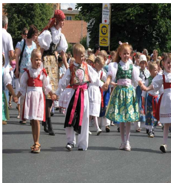
Obr.č.24- Strážnické děti v průvodu