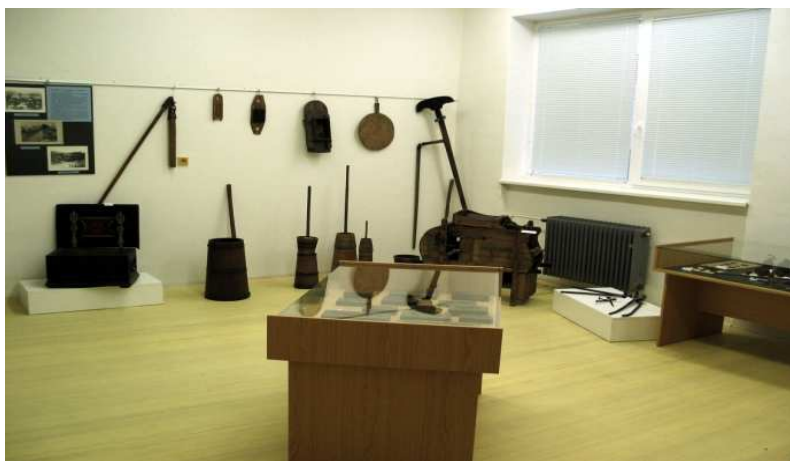
Obr.č.15 – Městská knihovna- expozice (internet-2)

Kromě výstavních prostor je v prvním patře umístěn i depozitář, kde se shromažďují sbírkové předměty, které nejsou vystavovány. V současné době je zde umístěno několik stovek sbírkových předmětů, přičemž základ této sbírky byl vytvořen již před několika desítkami let, v době, kdy bylo ve Bzenci založeno jeho první muzeum. Počet sbírkových předmětů se postupně rozrůstá o nové exponáty, které do expozice věnovali obyvatelé našeho města.