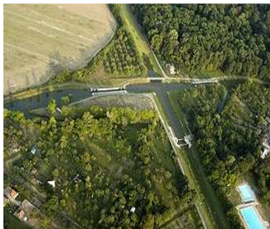
Obr.č. 22- Bařuv kanál- letecký snímek (internet-14)