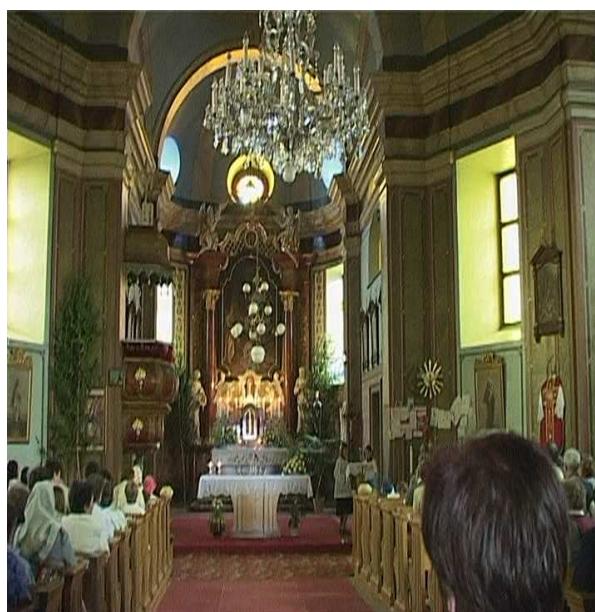
Obr.č.14 - Interiér kostela při bohoslužbě (internet-8)