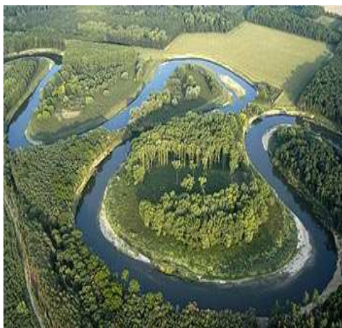
Obr. č.21- Meandry Bařova kanálu (internet-14)

Kromě těchto akcí probíhají v půjčovnách v průběhu celé sezóny různé zábavní večery, country a grilování, zkrátka vše co k létu patří.