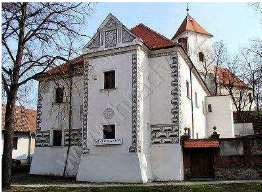
Obr.č. 12- Kyjovský zámek ( internet-10 )

Prvním světským držitelem Kyjova, jenž koupil městečko od kláštera Hradiska, byl Jan Kuna z Kunštátu (od r. 1539), který začal blízko zbořeniště tvrze přímo pod svahem, na němž stál kostel, stavět renesanční zámek. Jeho průčelní stěna byla obrácena na západní stranu. Zde byl také vchod, který na rozdíl od nynějšího vchodu ležel poněkud jižněji. Z někdejší zámecké stavby se dochovaly pouze dvě třetiny. Nejsevernější část, přiléhající ke svahu, byla zničena požárem v r. 1636, takže ji bylo nutno později vybudovat na starých základech znovu. Kyjovská vrchnost bydlela na zámku jen krátce. V roce 1548 se totiž Kyjov vykoupil z poddanství dalšího majitele kyjovského panství, Jana Kryštofa Kropáče z Nevědomí, a stal se nejdříve městem komorním a pak královským. Zámek sloužil později jako ubytovna pro městské služebníky i pro důstojníky místní posádky. ( internet-10 )