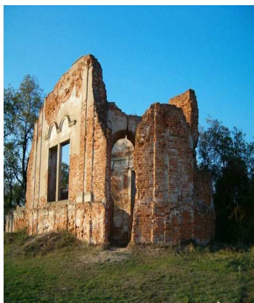
Obr.č. 20- Starý hrad (internet-13)