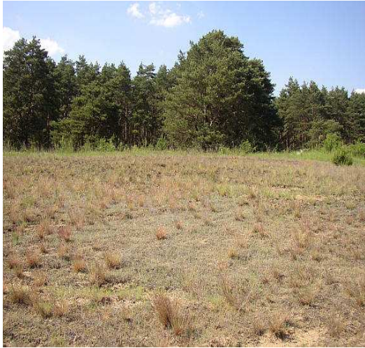
Obr.č. 17- Váté písky (internet-12)