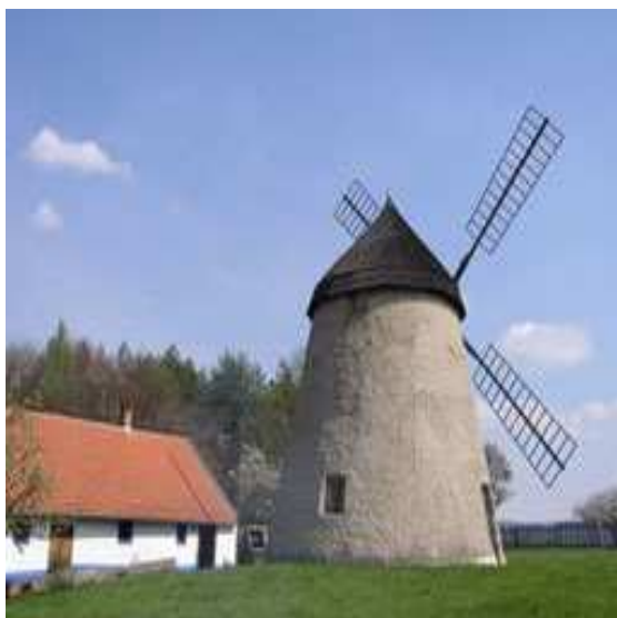
Obr. č. 27- Mlýn s hospodářským stavením (internet-16)

kteřá nese střechu se šindelovou krytinou. Střecha je uložena otočně a natáčena kolem svislé osy mlýna tak, aby větrné kolo bylo vždy nastaveno proti větru. Má čtyři křídla upevněná na konci hlavní hřídele. Vedle mlýna stojí přízemní budovy hospodářských stavení. Původní technické zařízení, umístěné ve třech podlažích mlýna (palečné a cévové kolo v nejvyšším podlaží, mlecí zařízení v druhém podlaží, moučnice s prosévacím zařízením v přízemí), dokládá technologický systém tzv. českého mlýnského složení. Vlastní mlecí zařízení se skládá ze dvou mlýnských kamenů. Horní běhoun je možno nadzvedávat a měnit mezeru podle způsobu mletí. V přízemí je postavena i zděná pec na pečení chleba. Do přízemí vedou dvoje dveře pro případ, že by se před některými z nich otáčelo větrné kolo. V přilehlých obytných a hospodářských budovách je zřízena expozice hornáckého bydlení a místního způsobu malovýrobního hospodaření z přelomu 19. a 20. století. Je zde vystaven soubor zemědělského náradí a zařízení dokumentující tradiční zemědělské výrobní postupy. Součástí expozice je i ukázka různých nástrojů používaných k údržbě strojního zařízení mlýna, kterou většinou prováděl sám mlynář.