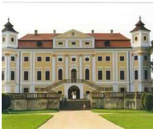
Obr.č. 32- Průčelí zámku (internet-18)

V mikroregionu Bzenecko je mnoho krásných a významných památek, vybrala jsem pro tuto bakalářskou práci ty nejpodstatnější památky, které stojí za zmínku.