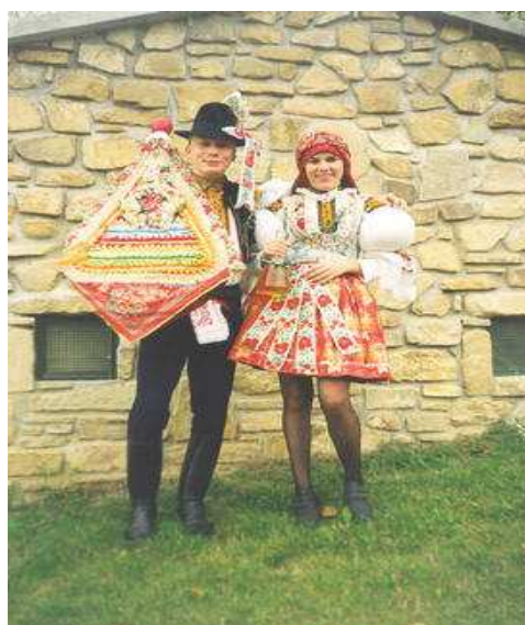
Obr.č. 3 - Stárek a stárka s právem (internet-5)