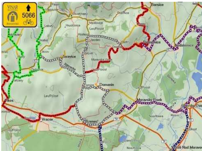
Obr.č. 16 - Situační plánec - vyznačení stezky (internet-11)