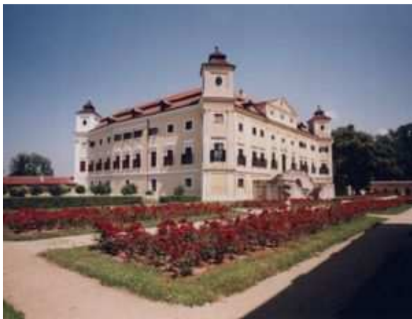
Obr.č 31- Milotický zámek s parkem (internet-18)