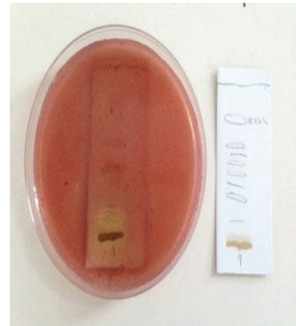
Figure 3/ Figura 3. Antimicrobial activity observed by the bioautography method of the P. neochilus acetonic extract obtained by the ultrasound technique. Atividade antimicrobiana obtida através do método de bioautografia do extrato acetónico do Plectranthus neochilus obtido por ultrassons.