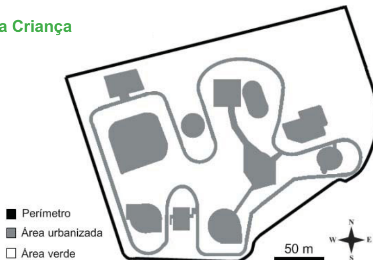
FIGURA 1: Perfil do Parque da Criança localizado no centro da cidade de Campina Grande, Paraíba, Brasil.