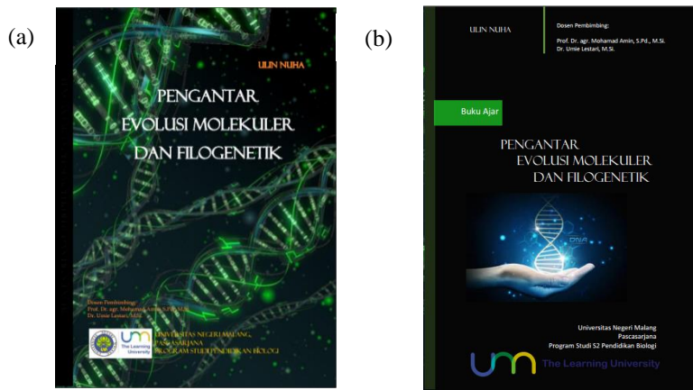
Gambar 1. Perbandingan Sampul Depan Buku: (a) sebelum revisi dan (b) sesudah revisi