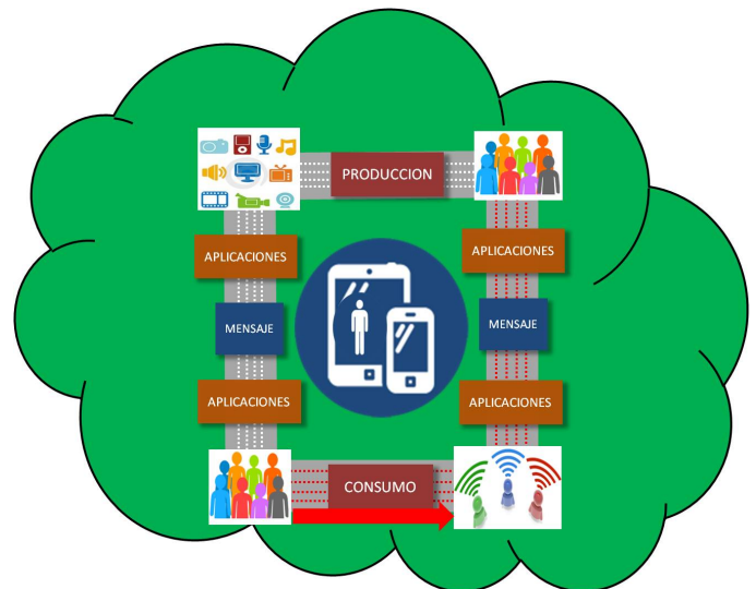
Figura 3. Análisis del caso 3: Sociedad de la comunicación inteligente (SCI)

En el futuro, los dispositivos inteligentes se habrán integrado totalmente en el usuario en sus diferentes actividades rutinarias, siendo capaz de interactuar con sistemas automáticos mientras se lleva a cabo cualquier otra tarea. Las aplicaciones se están convirtiendo en la herramienta para recrear un contenido recibido o visualizarlo a través de los dispositivos. Esto hace que los diferentes actores del proceso operen sobre la base de los contenidos disponibles o bien produzcan contenido de texto nuevo mediante las aplicaciones para generarlo o editarlo. Por tanto, a diferencia del CGU, donde podíamos definir más fácilmente los roles y localización de los actores del proceso de producción de contenidos, en la SCI estos se vuelven evidentemente más difusos y ciertamente intercambiables. El usuario desempeña simultáneamente la función “productor” y la función de “consumidor” de información textual generada por otros participantes del proceso —parte inferior de la figura— como receptor y como eslabón de la cadena de sentido.