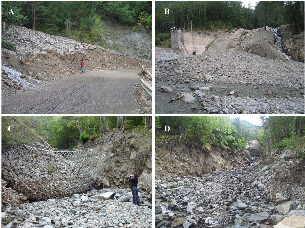
Figura 2. Imágenes de los efectos de las avenidas en Portainé. A) depósito de septiembre de 2008 en la intersección del barranco de Reguerals y la carretera (1465 m s.n.m.). B) depósito de septiembre de 2008 en la confluencia del río de Santa Magdalena con destrucción de la aleta de la presa. C) socavación en una barrera después del evento de agosto de 2010 en el barranco de Portainé (1350 m s.n.m.). D) erosión en el barranco de Portainé (1380 m s.n.m.) en agosto de 2013.

Los daños en las barreras se deben a la desviación del flujo debido a lluvias ordinarias hacia los laterales provocando la erosión entre el terreno y la barrera durante el flujo ordinario. Se propicia así el vaciado lateral de la barrera y el debilitamiento de los anclajes. Este proceso exige una mayor supervisión del funcionamiento y un mayor mantenimiento si se quiere mantener su funcionalidad y evitar la erosión de la ladera donde se sitúan los anclajes. Aunque en general las barreras han cumplido su función correctamente, una vez llenas, éstas no impiden que las avenidas con gran cantidad de carga sólida sigan propagándose hasta la confluencia con el río de Santa Magdalena (Furdada et al. , 2016; García-Oteyza et al. , 2015). La energía asociada a estos flujos torrenciales es todavía superior a la que pueden disipar las barreras.