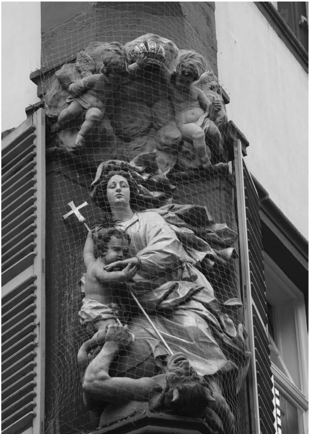
Inmaculada Concepción, siglo XVII, Heidelberg, Alemania