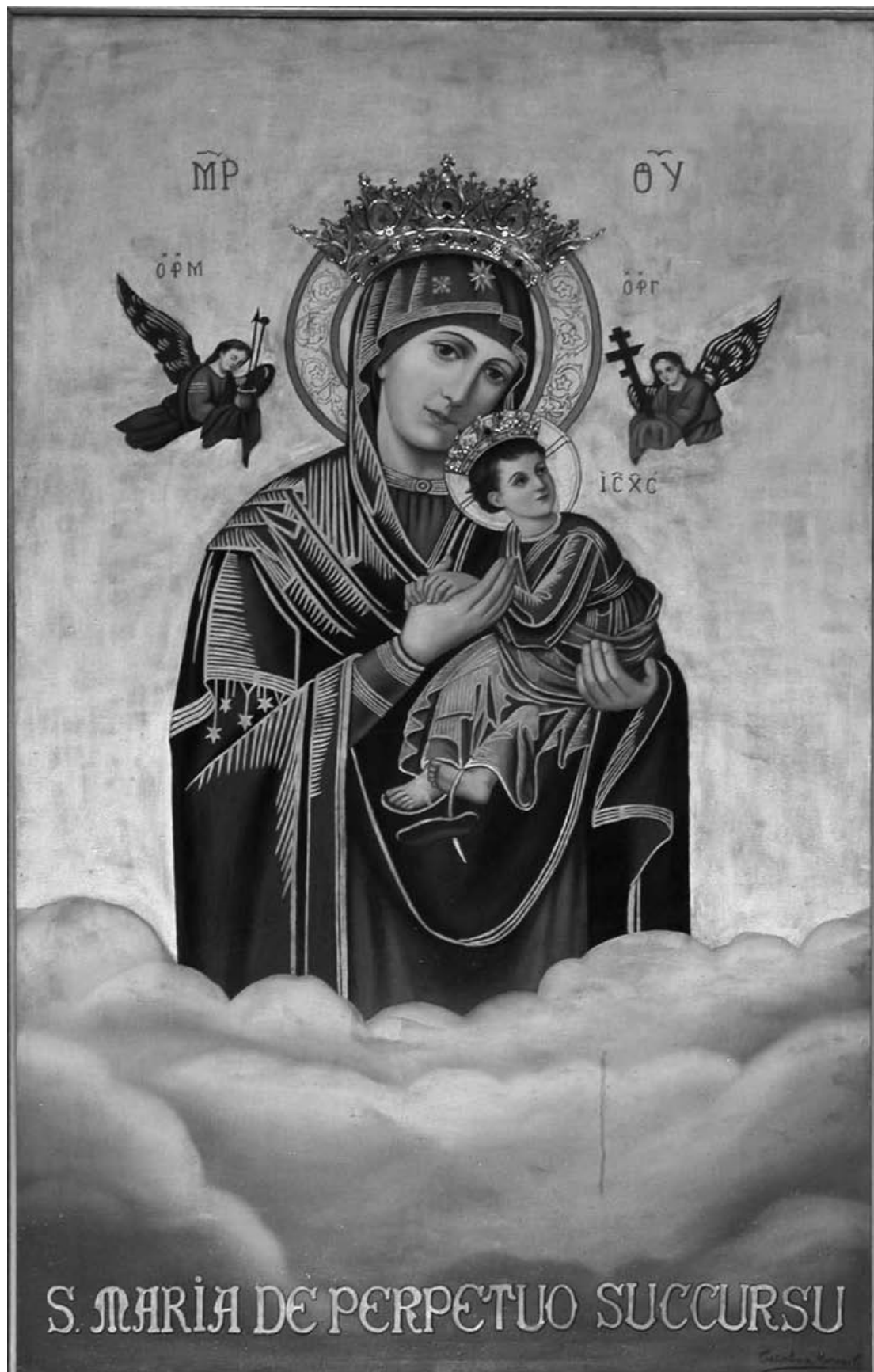
Virgen del Perpetuo Socorro, siglo XIX, Iglesia de San Pedro, Cholula, México