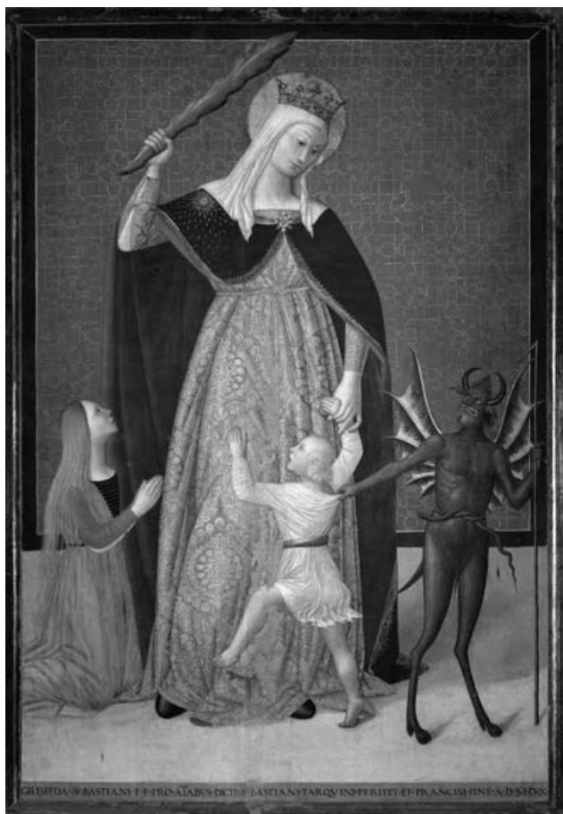
Virgen del Socorro, Tiberio di Assisi 1510. Iglesia de San Francisco, Montefalco, Italia.

del arte y poesía medievales. La más antigua colección de estos Milagros la escribió el monje benedictino Guglielmo Mahnesbury (1095-1147). Después, con los franciscanos y los dominicos, la literatura de los Milagros tuvo un nuevo florecimiento. Las dos colecciones de milagros más conocidas entre las muchas obras franciscanas y dominicas que existen, son: Speculum Historiale del dominico Fray Vincent de Beauvais (1264) y la Leyenda Aurea del fraile dominico Jacopo da Voragine 1298. De esta literatura monástica se originaron muchas obras vulgares en el siglo XIII, entre las cuales están las Cantigas de Santa María escrita en gallego por el rey de Castilla Alfonso X el Sabio en 1284, y muchas otras que se escribieron en Italia como la obra Miracoli dra madre del signor de Bonvesin da Riva (1313) (Levi, 1918: 2).