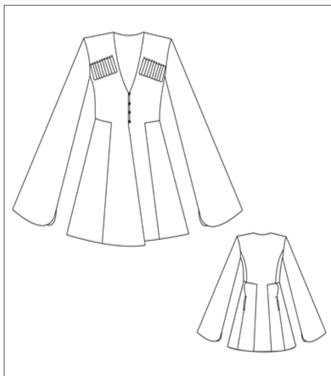
Рисунок 2 - Технический рисунок черкески (вид спереди, вид сзади)

Технический рисунок выполняется в графике (вид спереди, вид сзади) таким образом, чтобы прорисовывались конструктивные и конструктивно-декоративные линии (рис. 2).