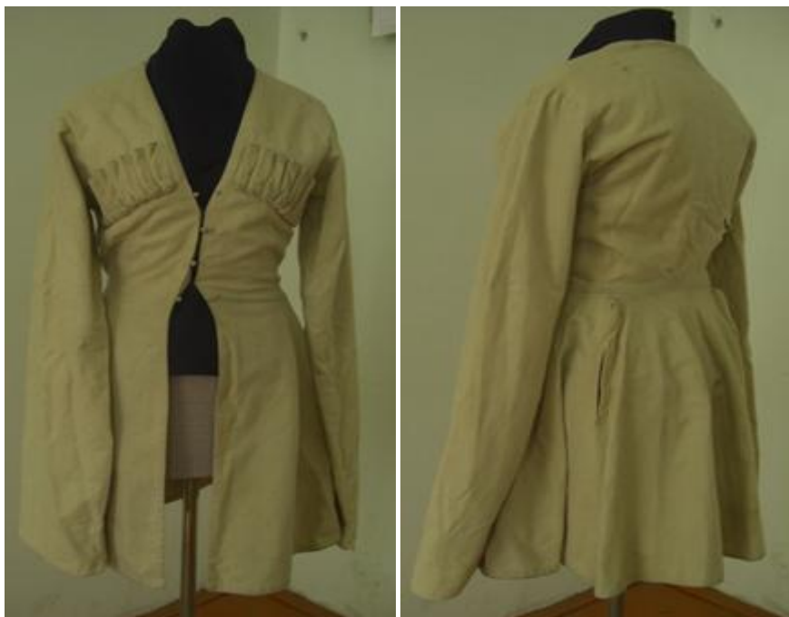
Рисунок 1 - Мужская черкеска (вид сбоку, вид спереди)

Приведем пример описания подлинного образца мужской черкески, предоставленной для исследования из частной коллекции (рис. 1).