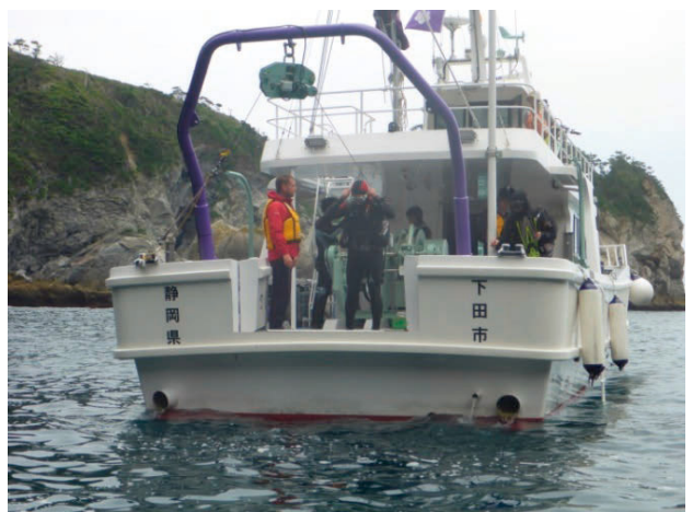
図3. 「つくばⅡ」を用いた潜水調査.

さらに、研究地点とコントロール地点で同時刻の状況を比較する場合に、「つくばⅡ」と「あかね」の両方で調査を行うことで、2地点で同時に同様の調査を遂行することも可能である。