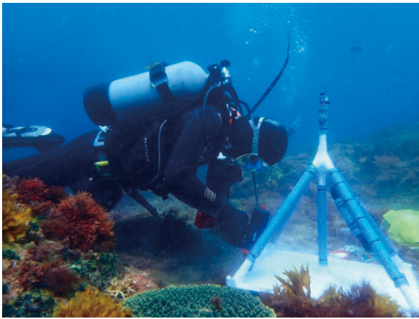
図 4. スキューバ潜水によるセンサー取り付け用の檣の設置。