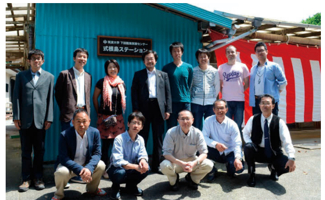
図2. 式根島ステーションの開所式.