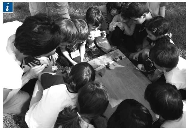
■ La corsa delle chioccioline.

Ore 13:30 circa Il pranzo alla scuola nel bosco arriva piuttosto tardi quando tutti hanno davvero fame. Prima ci si lava le mani (due secchi, sapone biodegradabile, asciughino e una lunga fila indiana; funziona), poi si prendono i cuscini e ci si dispone in cerchio sul prato, tutti attorno a un bel centrotavola costruito con i reperti naturali freschi di giornata o a una bella tovaglia multicolore. Prima di iniziare a mangiare (pane, pizza, pomodorini, mozzarelle, prosciutto, arancini di riso, verdura, frutta di stagione; un menù diverso ogni giorno) un momento di ringraziamento alla terra e al sole, agli