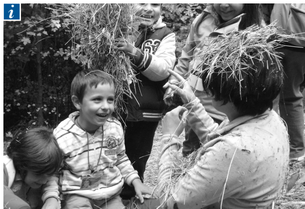
■ I bambini giocano e si divertono con la loro maestra.

Ore 9:25 Il pulmino giallo compare dietro la curva e entra nel parcheggio. Si aprono le porte. Il gruppo di 25 bambini sorridenti e rumorosi, scende e conquista l'attiguo e grande prato alberato. Esplorazioni, corse, inseguimenti, ma anche momenti di pausa e concentrazione, l'asse di equilibrio sul tronco del pioppo abbattuto e la ricerca delle formiche giganti che in quel tronco trovano rifugio. Il suono del picchio (un sonaglio di legno) richiama al cerchio di saluto. È un momento importante, una sorta di rito: si saluta il bosco con una canzoncina o una filastrocca che cambia in relazione alla giornata: canzone della pioggia o del sole, filastrocca dei funghi o della cornacchia che anche oggi è in attesa di un pezzo di torta. Si fa colazione (latte o succo, torta e biscotti; bicchieri riutilizzabili) e poi ci si interroga sul da farsi: si può andare alla capanna (la nostra base) e poi al cedro ferito, oppure spingersi fino al bosco fitto fitto. Si parte e il momento della partenza è sempre piuttosto concitato: bisogna rimettere i resti della colazione sul carretto, non dimenticare gli zainetti, distribuire i cestini per i tesori e le mappe per non perdersi. Il gruppo