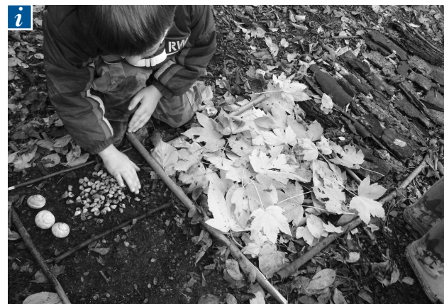
■ Collezioni d'autunno.