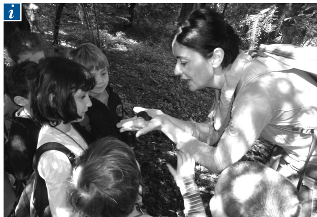
■ La lumaca lascia una stradina di bava luccicante.

difficilmente avanza compatto: i trasportatori (gravati dal trasporto del carretto carico di materiali) spesso rimangono indietro come pure i naturalisti-raccoglitori che si attardano con frutti e foglie. I cartografi, come è giusto, sono avanti ma c'è sempre qualcuno che li supera; del resto sono stati sufficienti due o tre giorni e nel parco ormai ci si orienta benissimo. Ogni tanto un grido testimonia un ritrovamento eccezionale e allora si accorre tutti a vedere; un giorno si è trattato di un rospo, un'altra volta di un lombrico, così lungo da sembrare un serpente.