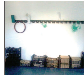
Fotografía 2. Material de refugallo industrial en caixas e colgado no colgadoiro