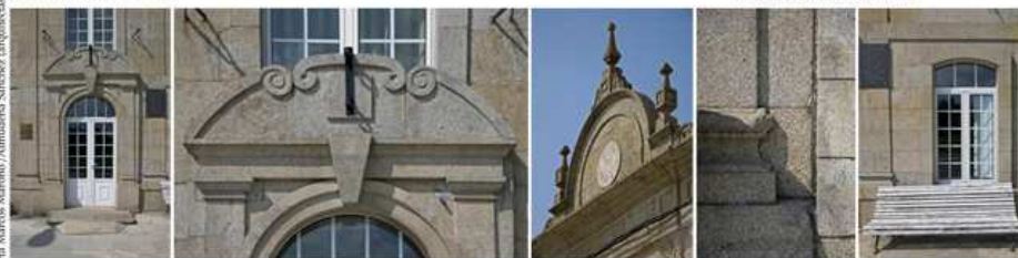
Detalles da fachada principal