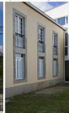
Alzado lateral da dobre altura

Imaxe: Pilar Aguiar (Marta Marqués Marandó/Almudena Sánchez Arquitectos)