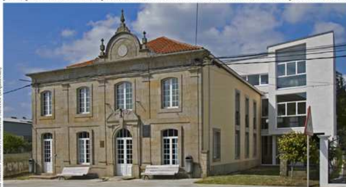
Vista da volumetría do edificio cunha ampliación recente

O edificio sitúase a carón da estrada. Trátase dun volume prismático regular con cuberta a catro augas. A fachada principal reflicte unha sorprendente estrutura asimétrica, froito dunha composición estudada que obedece á disposición