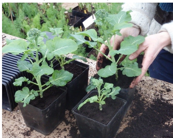
Abbildung 1: Topfen der Stecklingspflanzen im zeitigen Frühjahr.

Am Zuchtstandort Bingenheim (zwischen GI und FfM) traten in mehreren Jahren gravierende Schwierigkeiten im Samenbau auf. Aufgrund hohen Schädlings- und Krankheitsdrucks war der Samenansatz der selektierten Elitepflanzen oftmals sehr gering, teilweise konnte überhaupt kein Saatgut geerntet werden. Mit dem Stecklingsanbau wurde ein effektives Verfahren zur Sicherung des Zuchtfortschritts und Steigerung des Samenertrages entwickelt. Dabei wurden Triebe von den Elitepflanzen abgenommen und zur Bewurzelung in gärtnerisches Anzuchterdensubstrat in QuickPot®-Platten gesteckt. Die Erfolgsrate bei der Anzucht lag bei 60 bis 70 Prozent.