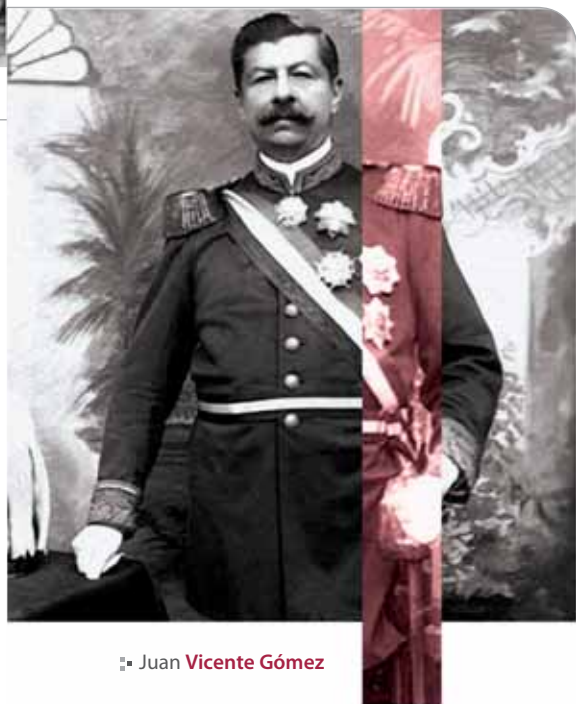
▪ Juan Vicente Gómez

Al despuntar el siglo XX, un grupo de sesenta hombres llamados “Los Andinos”, proveniente de la región del Táchira, se propuso llegar a Caracas para controlar el poder y poner fin a la era caudillista. Su máximo logro consistió, tal vez, en la centralización del poder. Su ejercicio, en cambio, permitió diferentes modalidades, con mayor o menor combinación de civilidad.