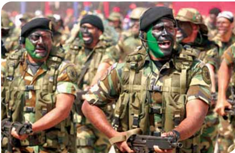
▪ Fuerzas Armadas venezolanas

Los giros de la fortuna, con la reivindicación que significó la amnistía propiciada por el presidente Rafael Caldera, y la persistencia en un proyecto político que había concebido con tiempo suficiente, le permitieron a Hugo Chávez aparecer en los siguientes comicios como candidato abanderado de un proyecto alternativo, añorado quizás por muchos venezolanos.