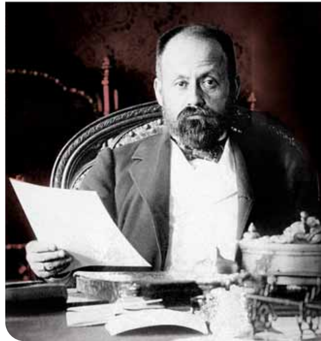
▣ Cipriano Castro

El presidente Hugo Chávez Frías anunció el 10 de enero de 2007, en el discurso de posesión de su tercer mandato, el inicio de una nueva etapa del proyecto político que puso en marcha cuando llegó al poder en 1999. El propósito fundamental de la nueva era sería el de la construcción del socialismo venezolano. Para conseguirlo, proclamó la necesidad de adoptar reformas institucionales y de organización territorial que conduzcan a lo que llamó "una nueva geometría del poder y a la abolición del Estado capitalista burgués para suplirlo por un socialismo del siglo XXI".