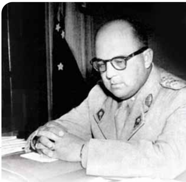
▪ Marcos Pérez Jiménez

Un golpe militar organizado por coroneles descontentos de las Fuerzas Armadas y animado por el recién fundado partido Acción Democrática, puso fin al gobierno de Angarita para dar paso a una Junta Revolucionaria que en 1945 dio inicio a lo que se conoce como el primer experimento democrático en Venezuela, llamado el “Trienio”. Pese a que en un principio recibió el apoyo de los militares, ellos mismos decidieron tomarse de nuevo el poder, tres años después, ya que a su juicio el partido gobernante —Acción Democrática— tenía aspiraciones comunistas.