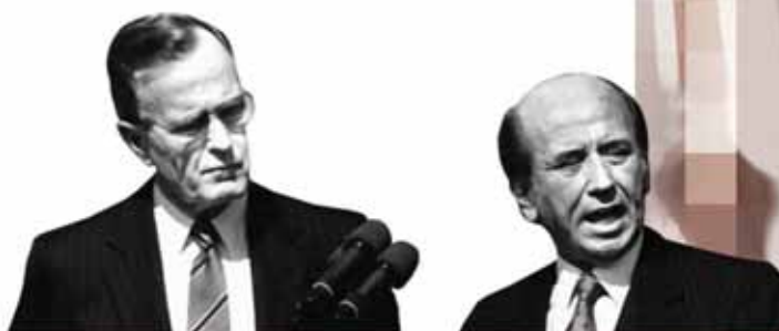
▣ Carlos Andrés Pérez

Estas intentonas, aunque inconstitucionales a todas luces, recibieron una buena dosis de aprobación popular, como expresión de protesta animada por la insatisfacción de intereses elementales