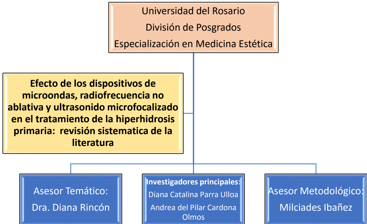
Figura 2: Organigrama