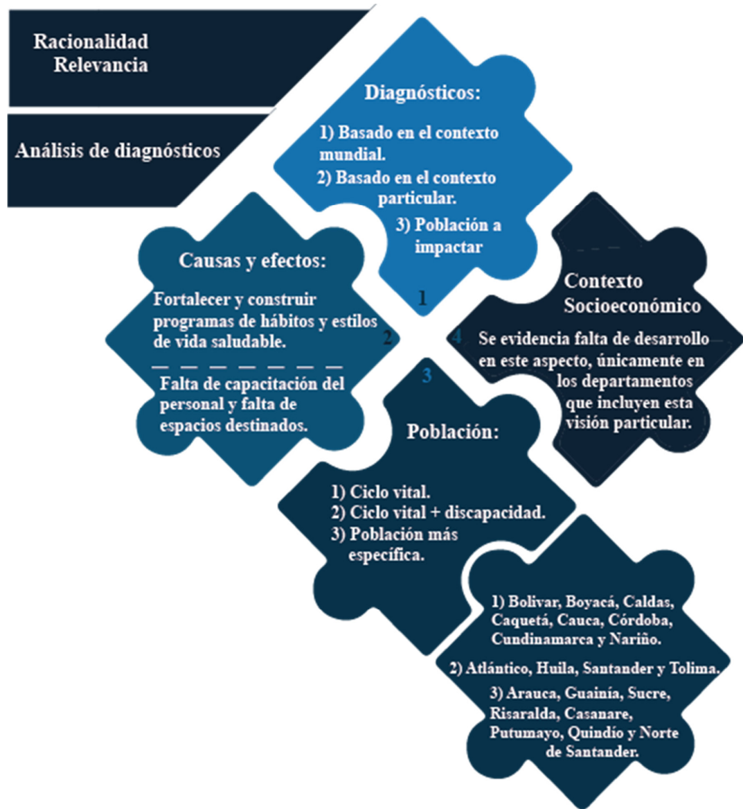
Figura 1: Resultado encontrado de la Relevancia de los programas departamentales de Hábitos y estilos de Vida Saludable.

La población objetivo que enuncian los programas se puede enmarcar en todo el ciclo vital, pero algunos extienden su cobertura a grupos especiales como población privada de la libertad, enfermos crónicos, entre otros. En la relevancia de los programas se presenta y analiza de forma poco detallada el contexto socioeconómico de los departamentos.