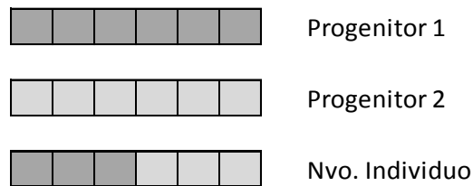
Ilustración 1. Cruce de Cromosomas básico

También se puede evidenciar como es el proceso de cruce básico en la ilustración 1, en la que cada una de las cadenas de ADN de los progenitores se divide a la mitad para luego unirse una de las mitades de cada uno, creando de esta manera un nuevo individuo. Y el cruce multipunto en la ilustración 2, el cual consiste en hacer un corte en dos o más puntos de la cadena de ADN de cada uno de los progenitores, para luego unirse nuevamente con partes de la cadena de ADN de cada uno de los progenitores con lo que se crea el nuevo individuo.