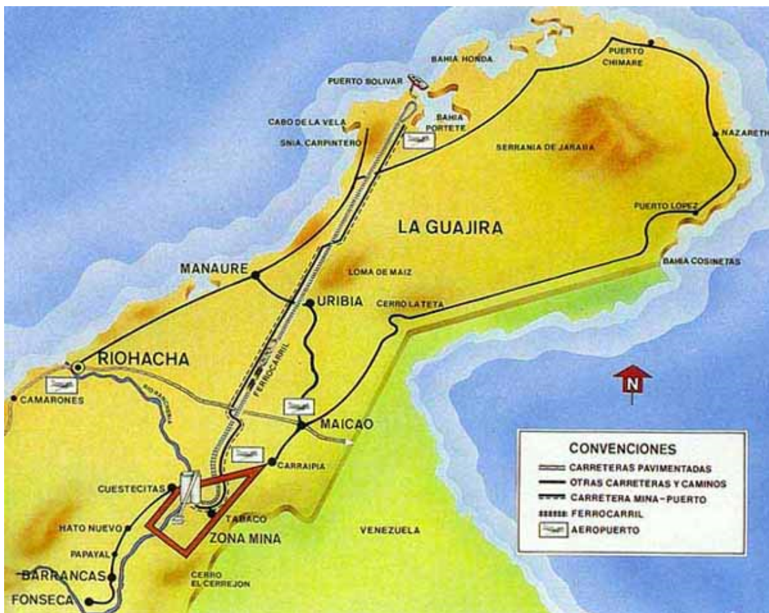
Gráfica N 3. Operación Carbones del Cerrejón en la Guajira