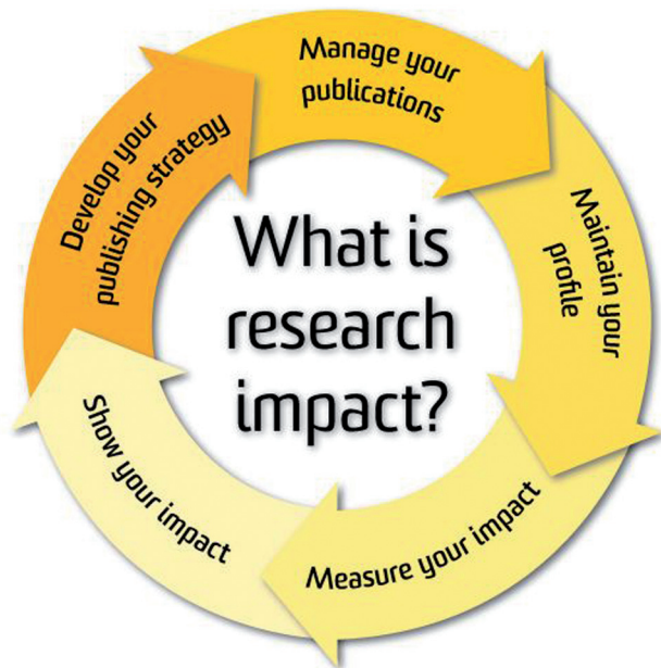
Abb. 2: Beispiel der Darstellung des Research Impact Cycle

versucht vielmehr, das Thema ganzheitlich anzugehen und zu erklären, wie die verschiedenen Elemente oder Phasen des Publikationszyklus ineinander greifen und so den Research Impact beeinflussen. Zu den Elementen oder Phasen dieses Zyklus gehören die Entwicklung einer geeigneten Publikationsstrategie, die professionelle Verwaltung der eigenen Publikationen, die Pflege des Autorenprofils (z. B. ORCID, Researcher-ID, Google Scholar ID), die Impact-Messung sowie die Selbstdarstellung der eigenen Ergebnisse (vgl. Abb. 2).