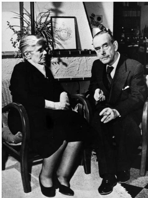
Thomas und Katia Mann 1953

Man könnte weitere ähnliche Zitate anhäufen, und das Hohelied der Mathematik weiter singen, das da