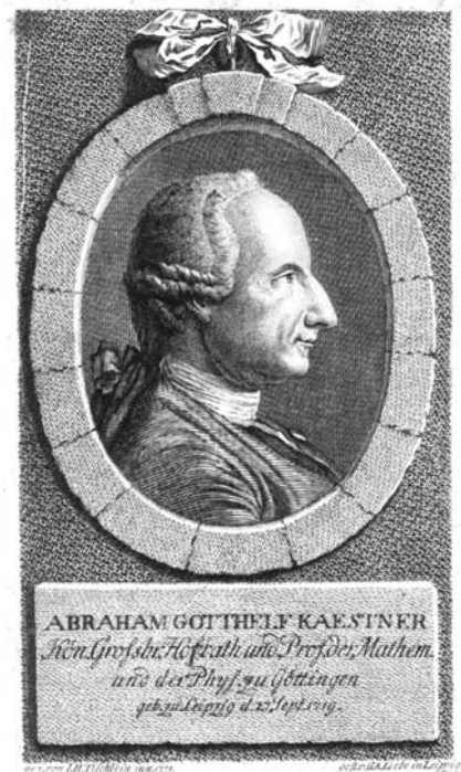
Johann Heinrich Tischbein, Abraham Gotthelf Kästner 1719–1800