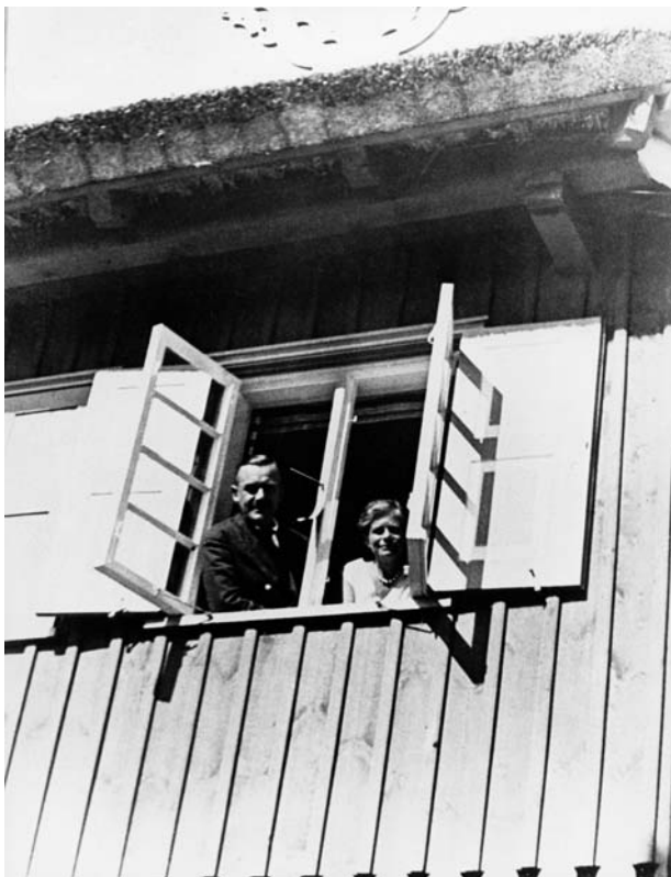
Thomas und Katia Mann im Ferienhaus Nidden, Sommer 1930

Für das Verständnis der Fortsetzung des Textes von Thomas Mann dürften für Nichtmathematiker die folgenden Erklärungen hilfreich sein. Die Quadratur des Kreises ist ein mathematisches Problem, welches seit dem griechischen Altertum nicht nur professionelle Mathematiker sondern auch Laien immer wieder angesprochen hat. Mathematisch kann es auf Eigenschaften der Zahl \pi zurückgeführt werden. Der Mathematiker Ferdinand Lindemann 28 konnte 1882 zeigen, dass die Zahl \pi – wie die Mathematiker sagen – transzendent ist und dass aus diesem Grund die Quadratur des Kreises mit Zirkel und Lineal nicht durchführbar ist.