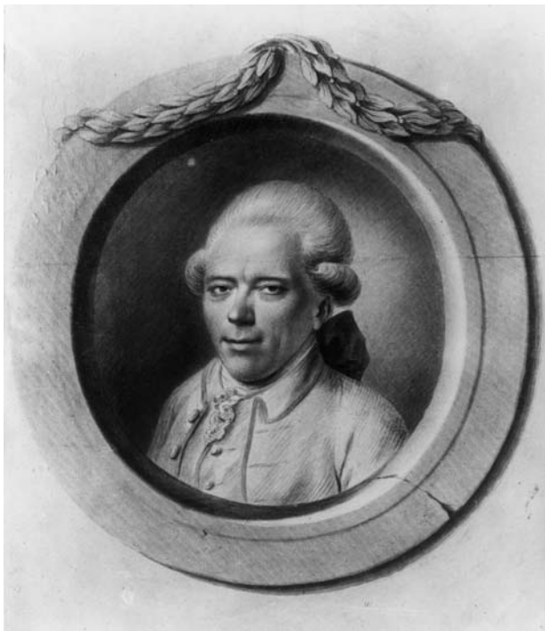
Ludwig Strecker, Georg Christoph Lichtenberg (1742–1799) (Bildarchiv Preußischer Kulturbesitz)

Kraftvoll zu Wort meldete sich zu dieser Kontroverse Alfred Pringsheim, 4 Ordinarius für Mathematik an der Universität München. In einem Vortrag Über Wert und angeblichen Unwert der Mathematik 5 anlässlich der Feier des 145. Stiftungstages der Königlich-Bayrischen Akademie im Jahre 1904 unterzog er die Auffassung Schopenhauers einer detaillierten Kritik. Ich will hier auf die einzelnen Punkte nicht eingehen, welche die Mathematik selbst betreffen, obschon sie durchaus Aufmerksamkeit verdienen, sondern ich beschränke mich auf die Ausführungen Pringsheims zum Lichtenberg Zitat. Hier wirft Pringsheim dem Philosophen eine plumpe und bösertige Fälschung vor. Schopenhauer habe nur den zweiten Teil des Aphorismus von Lichtenberg zitiert und damit die Aussage völlig verfälscht. In der Tat hatte Schopenhauer den ersten Satz weggelassen: