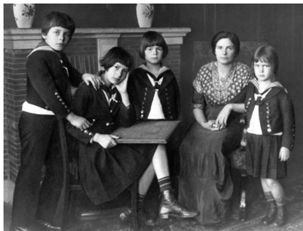
Katia Mann, mit Klaus, Erika, Golo und Monika, 1915

In einer krausen, kindlich dick aufgetragenen Schrift, die Imma Spoelmanns besondere Federhaltung erkennen liess, bedeckte ein phantastischer Hokuspokus, ein Hexensabbat verschränkter Runen die Seiten. Griechische Schriftzeichen waren mit lateinischen und mit Ziffern in verschiedener Höhe verkoppelt, mit Kreuzen und Strichen durchsetzt, ober- und unterhalb waagrechter Linien bruchartig aufgereiht, durch andere Linien zeltartig überdacht, durch Doppelstrichelchen gleichgewertet, durch runde Klammern zu grossen Formelmassen vereinigt. Einzelne Buchstaben, wie Schildwachen vorgeschoben, waren rechts oberhalb der umklammerten Gruppen ausgesetzt. Kabbalistische Male, vollständig unverständlich dem Laiensinn, umfassten mit ihren Armen Buchstaben und Zahlen, während Zahlenbrüche ihnen voranstanden und Zahlen und Buchstaben ihnen zu Häupten und Füßen schwebten. Sonderbare Silben, Abkürzungen geheimnisvoller Worte waren überall eingestreut, und zwischen den nekromantischen Kolonnen standen geschriebene Sätze und Bemerkungen in täglicher Sprache, deren Sinn so hoch über allen menschlichen Dingen war, dass man sie lesen konnte, ohne mehr davon zu verstehen, als von einem Zaubergemurmel.