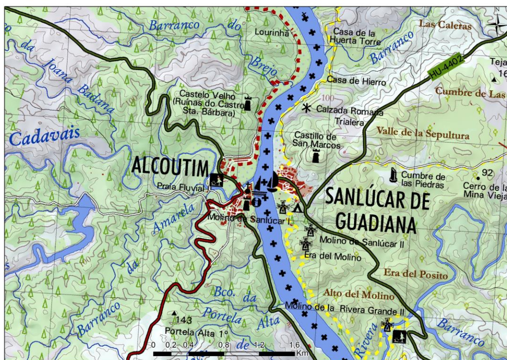
Mapa 1. Detalle del mapa del ámbito transfronterizo del Bajo Guadiana

Escala 1:50.000. Instituto de Estadística y Cartografía de Andalucía y Direção-Geral do Território, Instituto Geográfico Nacional 2013.