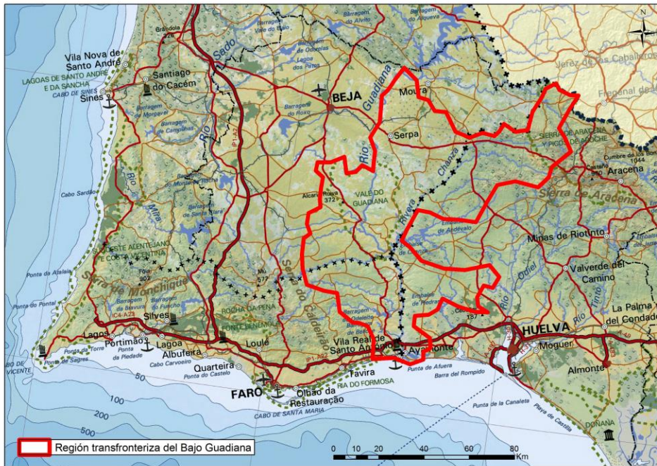
Mapa 2. Localización de la región transfronteriza del Bajo Guadiana

Fuente: Consejería de Medio Ambiente y Ordenación del Territorio. Junta de Andalucía.