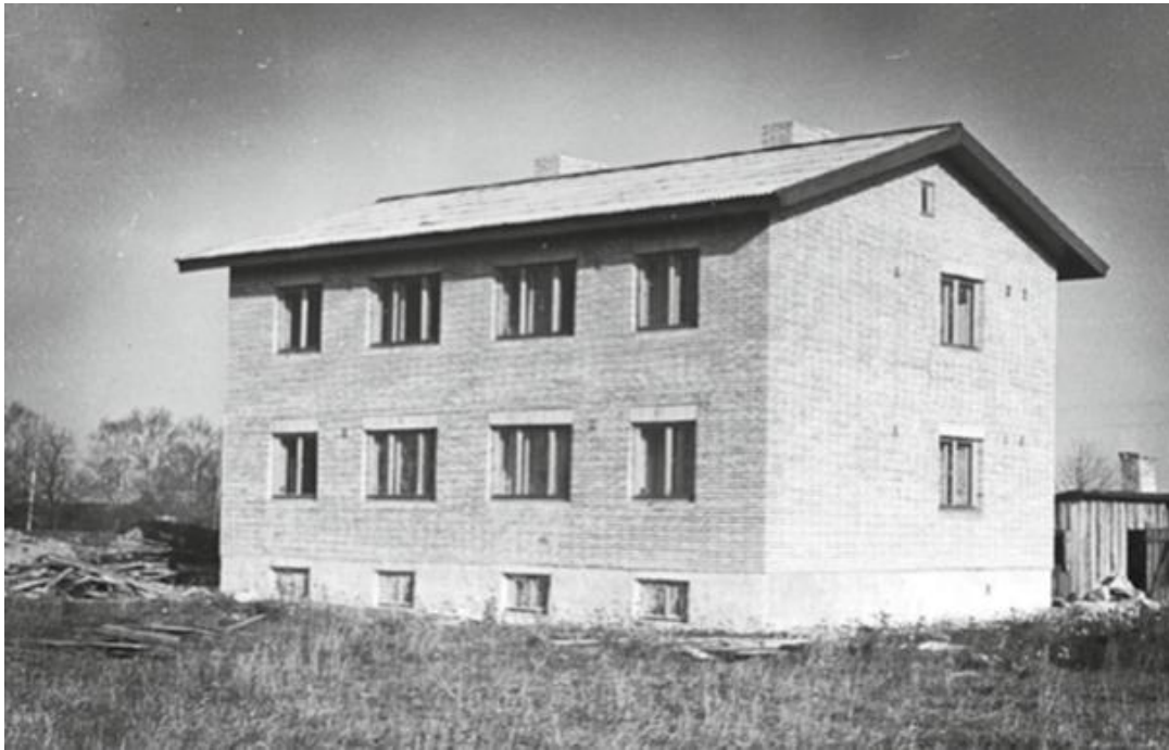
Joonis 2. Tüüpiline nõukogudeaegsete maa-asulate kortermaja.