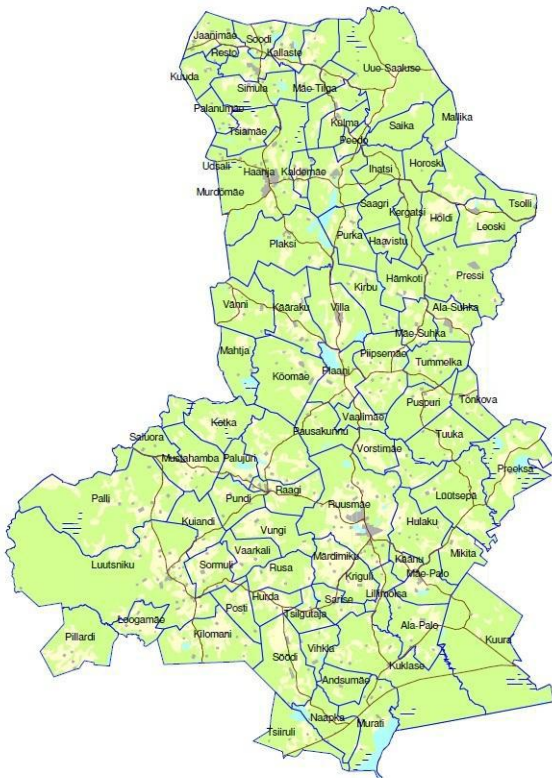
Joonis 4. Tänapäevase Haanja valla asulad ning nende lahkmejooned.