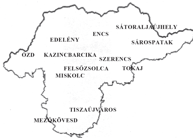
2. ábra. A közoktatási ellátási körzetek központjai Borsod-Abaúj-Zemplén megyében

Az önkormányzatoknak 1990 óta törvény adta lehetőségük, hogy feladataik hatékonyabb ellátásához társulásokat hozzanak létre. Az önkormányzatok, az iskolák magukra maradtak problémáikkal, a közoktatásban dolgozók – különösen a „végeken” – információhiányban szenvedtek, az önkormányzatok nagy részénél, az iskolafenntartóknál hiányoztak a hozzáértő szakemberek. A körzeti szolgáltatásokat nyújtó intézmények megszűntek, rászoruló gyerekek tömegei maradtak ki olyan fontos ellátásokból, mint a logopédia, a nevelési tanácsadás, a gyógytestnevelés, a különböző fejlesztő foglalkozások. A problémát felismerve, a megyei önkormányzat kezdeményezésére és a megyei Közoktatási Közalapítvány támogatásával 1997-ben társulásokat hoztak létre, az országban elsőként és eddig egyedülálló módon.