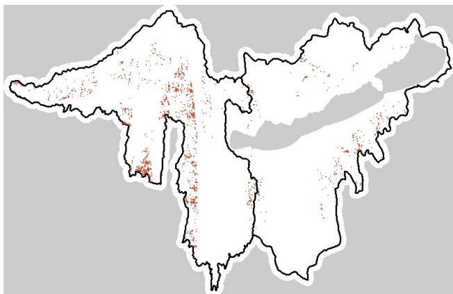
4. ábra. Vízmosások a meredek löszterületeken

A szakirodalomban a badland területek átlagosan elég meredek, de arra is találunk utalást, hogy akár 1 százalék lejtő esetén is kialakulhat vízmosás, ha a felszíni beszivárgás akadályozott, ugyanakkor az alagosodás is jelen van. Ez különösen meszes löszön gyakori (Valentin és mtsai, 2005). A világon a legtöbb hordalékot fajlagosan a nagy folyamok közül a Sárga-folyó szállítja (Shi és Shao, 2000), és ennek fő oka a kínai löszfennsík badland jellegű eróziója. Ebből arra következtethetünk, hogy a Balaton vízgyűjtőjén is elsősorban a meredek löszös területeken várható a tájhasználat és a klímaváltozás hatására jelentős változás, akár badland jellegű erózió is. Megvizsgáltuk, hogy a meredek löszös területeken mekkora a vízmosások sűrűsége, ami több, mint 1876m/km 2 értéknek adódott, és ez több, mint háromszorosan haladja meg az erősen vízmosásos erózió határértékét (500m/km 2 ), és több, mint ötszörösen haladja meg a vízgyűjtő átlagát (361m/km 2 ). Szubhumid észak-spanyolországi példák is mutatják (Nadal-Romero és mtsai, 2012), hogy ilyen körülmények között a badland formáció kialakulása nem összefüggő nagy területeken, hanem kis foltokban kezdődik, de a feltételek változása esetén a jelenség gyorsan terjedhet. Tulajdonképpen a feltételek Magyarországon is adottak ehhez a káros folyamathoz. A kutatás következő szakaszában azt elemezzük részletes terepi felvételezés alapján, mennyire játszódott le máris a folyamat, és modellezzük a lehetséges jövőbeli alakulását.