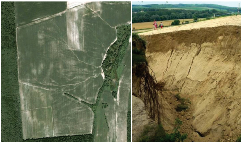
2. ábra. Barázdás és vízmosásos erózió a Balaton déli vízgyűjtőjén (Somogybabod)

Ezen területek közül a legszárazabbak már most is a jelentős mértékű (mediterrán jellegű) erózióval sújtott, barázdák és vízmosások által szabdalta tájakhoz tartoznak, ahogy azt Gábris és munkatársai (2003), Jakab (2008) és mások kutatásai is megmutatták.