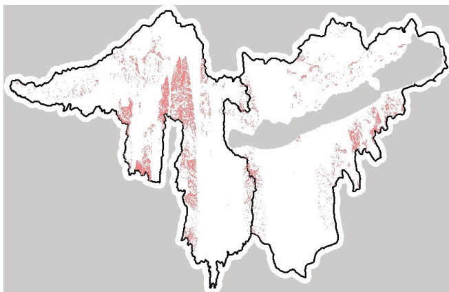
3. ábra. A 12 százaléknál nagyobb meredekségű löszterületek

A 3. ábrán láthatók azok a löszterületek, ahol a meredekség nagyobb, mint 12 százalék.