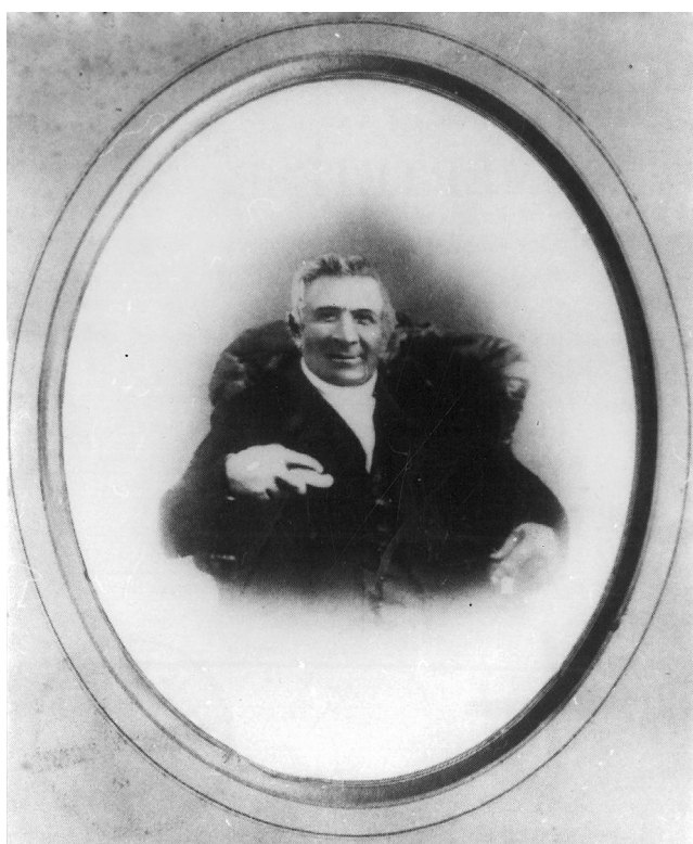
1. ábra | Korabeli fénykép Csorba Józsefről.

Csorba József a magyar orvostudomány jelentős alkotója. Nagyszőlősen (Ugocsa megye) (jelenleg Vinohradiv – Nagyszőlősi járás Ukrajnában) 1789. január 11-én született [1]. „Szegény szülőktől születtem – írja önéletrajzában –, kik noha betűt nem ismertek, mégis mind engem, mind testvéreimet iskolába jártni és maguktól megvonva is illendően nevelni el nem múltatták.” Elemi iskoláit a nagyszőlősi református iskolában, majd Máramarosszigeten és Sárospatakon végezte, később a debreceni kollégiumba került. Hónapokon át nevelő volt Sárospatakon Majthényi főispán fia mellett („1000 váltó forint évi díjazással”), hogy tanulmányaira pénzt szerezzen.