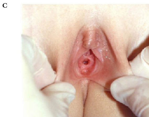
1. ábra | Az orvosi vizsgálat típusai. A Hanyatt fekvő helyzet. B Nagyajkak szétválasztása. C Nagyajkak széthúzása

egyszerű legyen, nyitott kérdésekkel, fokozatosan kell a beszélgetést az esetleges szexuális zaklatás irányába terelni. Kerülni kell az előítéletet, a kritizálást és a minősítést. A beszélgetés közben meg kell próbálni nyugodtnak és segítőkésznek lenni, a beteg bizalmát elnyerni annak érdekében, hogy a lehető legtöbb információ derüljön ki. Az áldozat számára lehetőséget kell adni arra, hogy a saját kérdéseit feltehesse. Az elmondott történetnek tartalmaznia kell a bűncselekmény idejét, helyét, körülményeit, az elkövető jellemzőit, és a zaklatás típusát, az esetleges