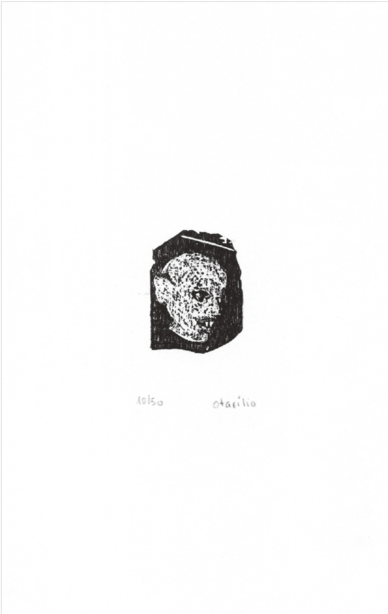
Figura 5 - Otacílio Camilo, Sem título, sem data (meados dos anos 80). Xilogravura sobre entretela. Dimensões do suporte: 19,5x13,4 cm.