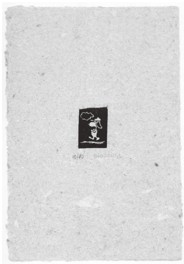
Figura 4 · Otacílio Camilo, Sem título, 1986. Xilogravura sobre papel artesanal. Dimensões do suporte: 28x19 cm.