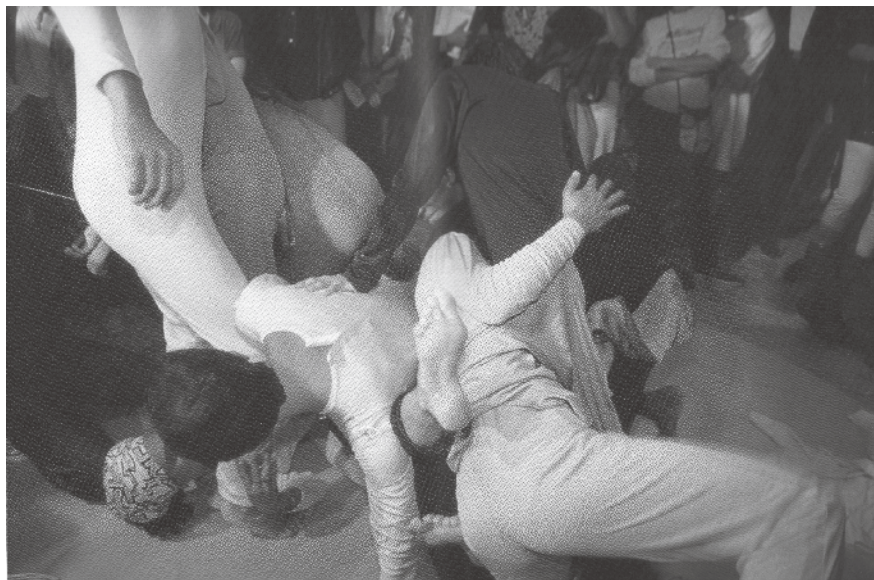
Figura 3 - Lygia Clark, O eu e o Tu (1968).