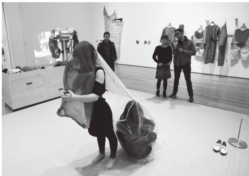
Figura 1 · Lygia Clark, Máscara Abismo (1968)