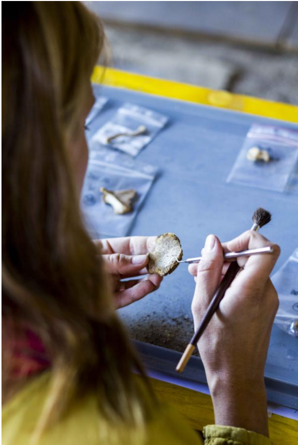
Fig. 1. Studio antropologico delle sepolture.