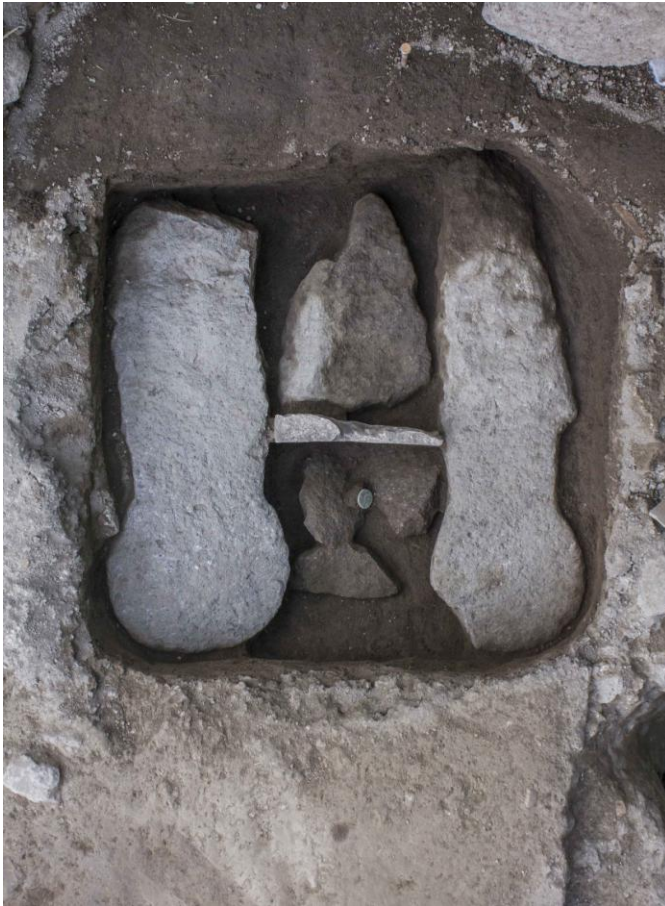
Fig. 7. Sistemazione di SP. 3 dopo la rimozione della mensa.