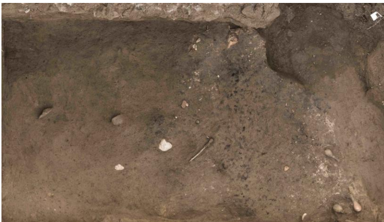
Fig. 9. Vista generale della pira anteriore alla costruzione del recinto 1F.

del recinto, senza segnaoli in superficie. Nella prima sono deposte le ossa bruciate di una donna probabilmente morta piuttosto giovane. Le ossa erano contenute in un sacco. Nella seconda tomba, i resti ossei appartengono a un infante morto tra i 4 e i 7 anni. Lo scavo dei livelli della parte nord del recinto ha permesso di identificare i resti di una pira (fig. 9). Su quest'ultima sono presenti una lucerna rotta e numerosi balsamari in vetro o terracotta. Il deposito contiene anche degli oggetti spesso collegati a tombe di infanti, campanella, pedine da gioco (?). L'insieme è datato all'età augustea o augustea-tiberiana. La pira sembra tagliata da uno dei