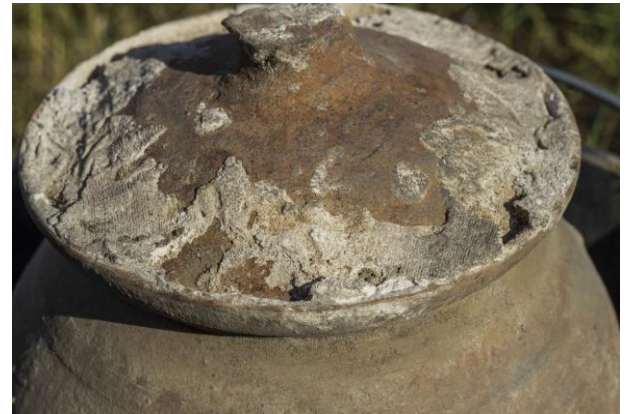
Fig. 8. Impronte di tessuto sul coperchio dell'urna dell'urna della SP 1F6 (©William Van Andringa, Mission Archéologique de Porta Nocera).

del recinto, senza segnaoli in superficie. Nella prima sono deposte le ossa bruciate di una donna probabilmente morta piuttosto giovane. Le ossa erano contenute in un sacco. Nella seconda tomba, i resti ossei appartengono a un infante morto tra i 4 e i 7 anni. Lo scavo dei livelli della parte nord del recinto ha permesso di identificare i resti di una pira (fig. 9). Su quest'ultima sono presenti una lucerna rotta e numerosi balsamari in vetro o terracotta. Il deposito contiene anche degli oggetti spesso collegati a tombe di infanti, campanella, pedine da gioco (?). L'insieme è datato all'età augustea o augustea-tiberiana. La pira sembra tagliata da uno dei