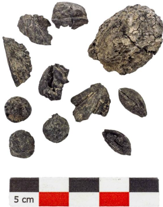
Fig. 5. Elementi carbonizzati ritrovati sulla carreggiata.

associato, oltre a dei carboni e un ciocco quasi completo, sono presenti numerosi frammenti di osso lavorato e una lucerna.