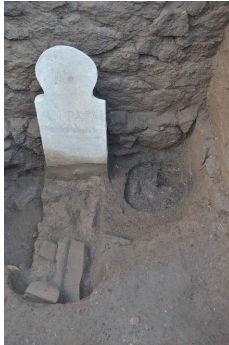
Fig. 3. Vista zenitale del recinto 26a (© Flore Giraud, Mission Archéologique de Porta Nocera).