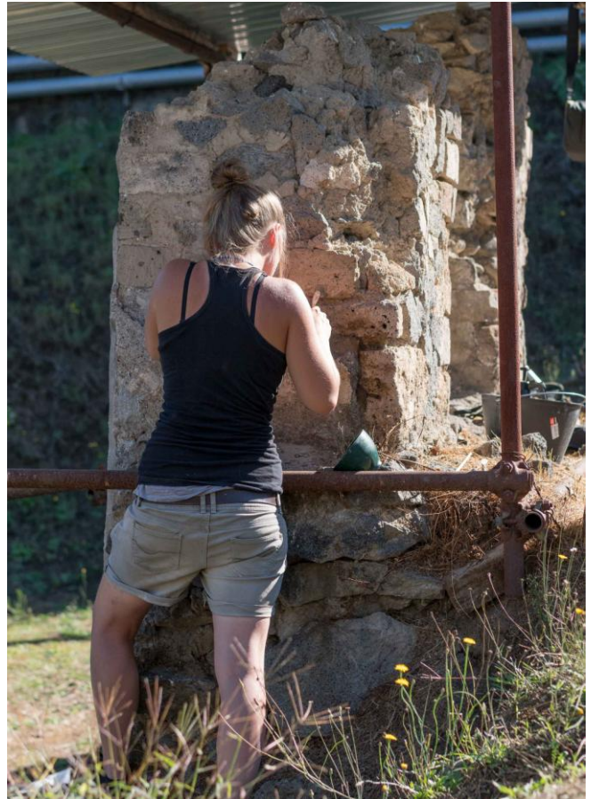
Fig. 2. Restauro del monumento 3G, Porta Nocera Est (© Johannes Laiho, Mission Archéologique de Porta Nocera).

bambini morti in giovane età che ricevevano, in alcuni casi, un posto nei recinti funerari.