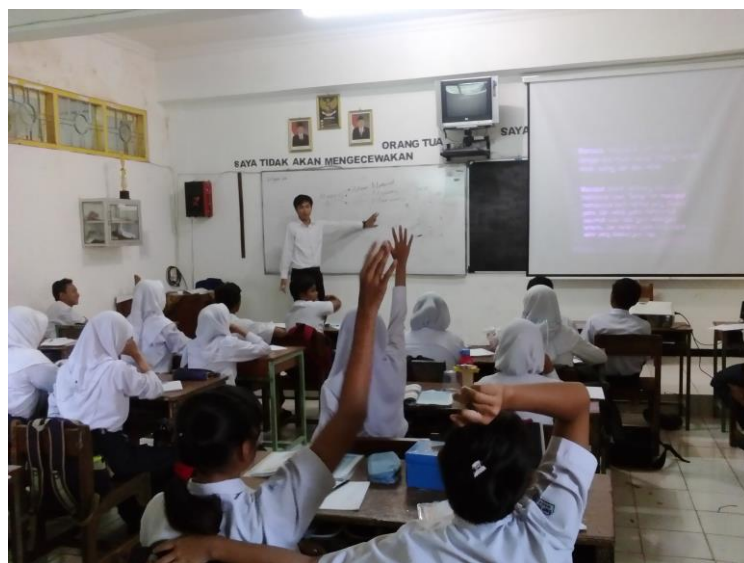
Mengajar Kelas VIII A pada hari Senin