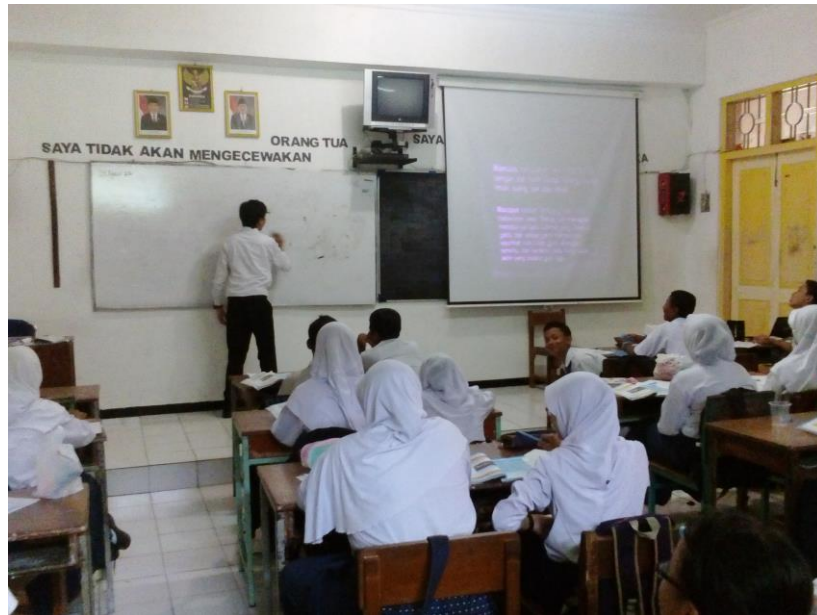
Mengajar kelas VIII A