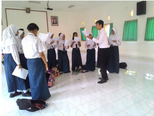
Mengajar Ekstra Paduan Suara