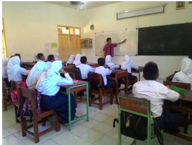
Piket Mengajar kelas VII F. Rabu, 24 Agustus 2016 materi “Menyanyikan Lagu Twinkle-twinkle”