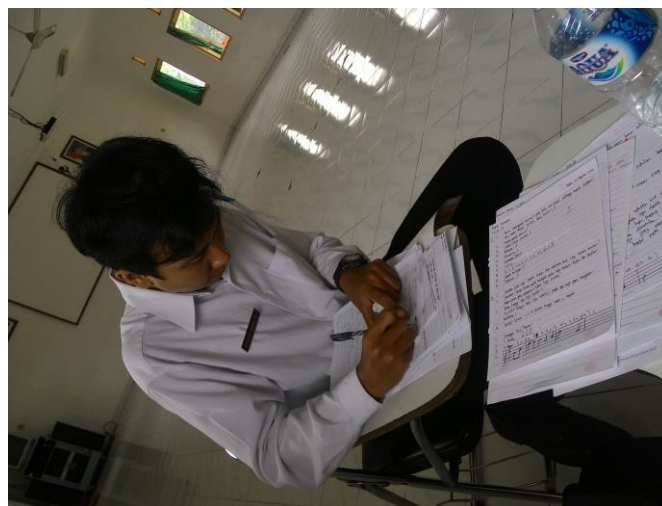
Mengoreksi Lembar Kerja Peserta Didik