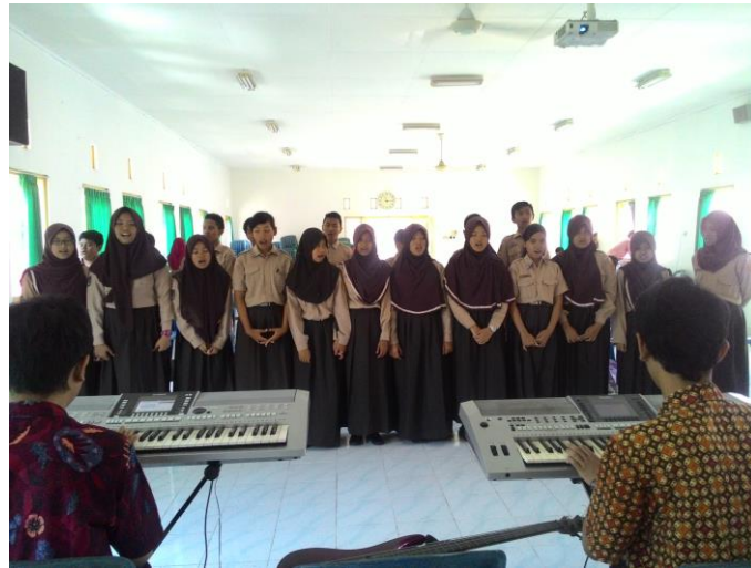
Mengajar Ekstra Paduan Suara untuk upacara bendera harin