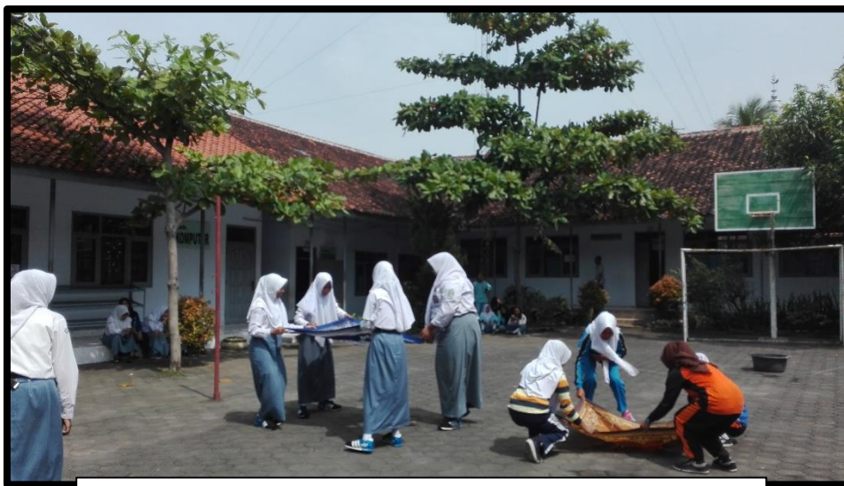
LOMBA PERINGATAN HARI KEMERDEKAAN RI KE-71