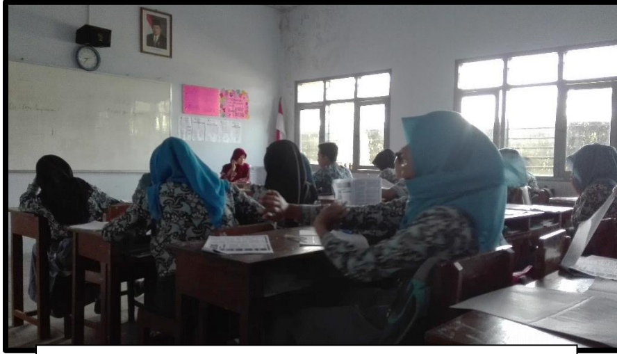
OBSERVASI KELAS SEBELUM PELAKSANAAN PPL