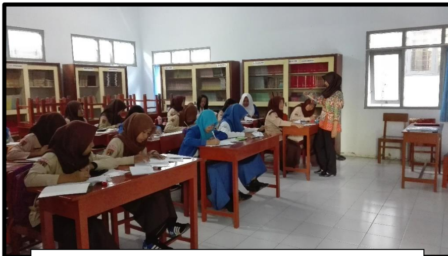
KELAS XI AK SMK ABDI NEGARA MUNTILAN