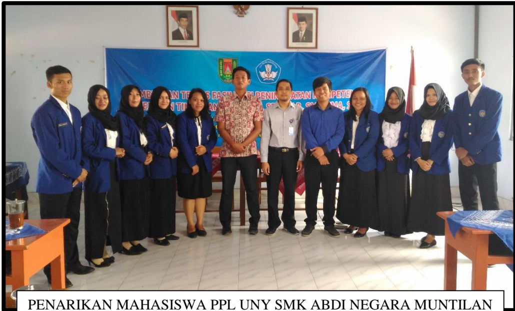
PENARIKAN MAHASISWA PPL UNY SMK ABDI NEGARA MUNTILAN