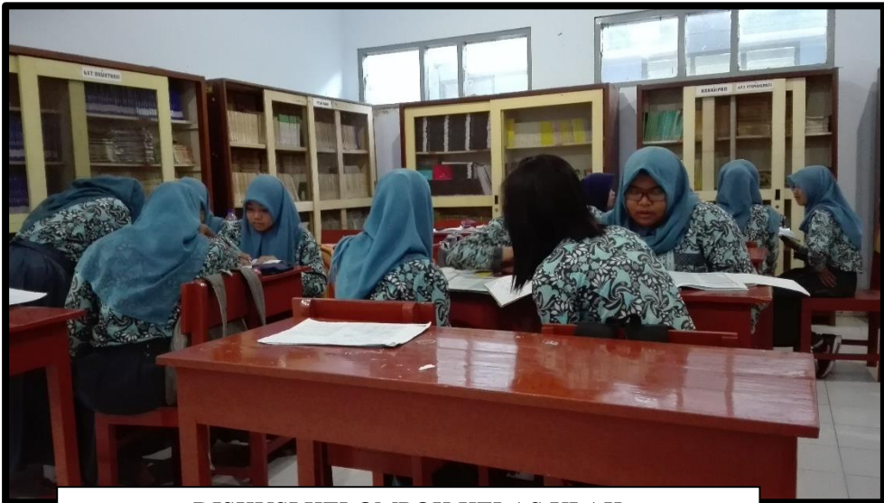
DISKUSI KELOMPOK KELAS XI AK