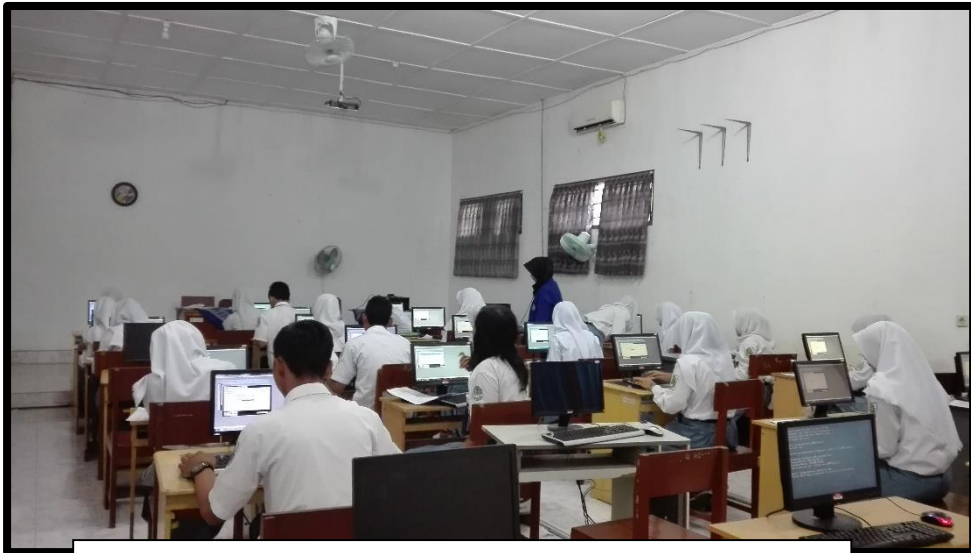
KELAS XII AK SMK ABDI NEGARA MUNTILAN