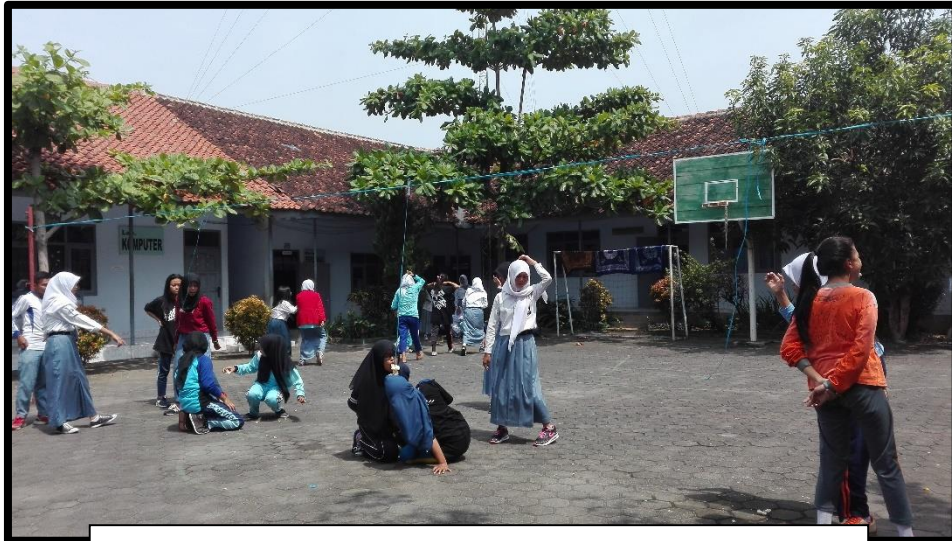
LOMBA PERINGATAN HARI KEMERDEKAAN RI KE-71