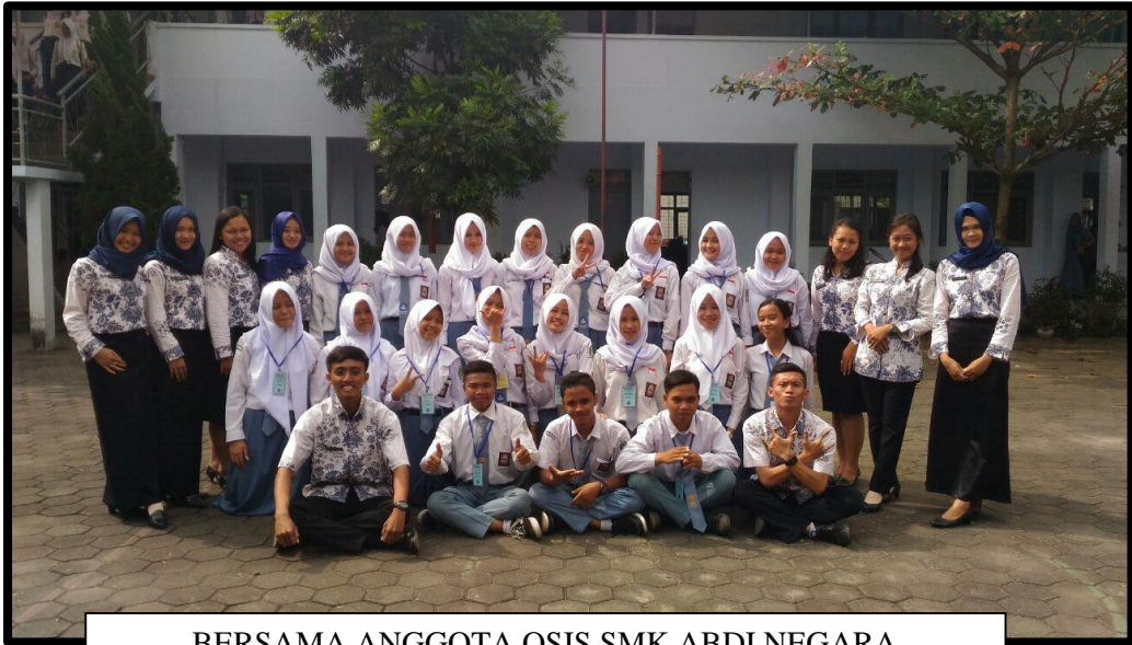
BERSAMA ANGGOTA OSIS SMK ABDI NEGARA