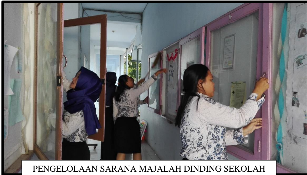
PENGELOLAAN SARANA MAJALAH DINDING SEKOLAH