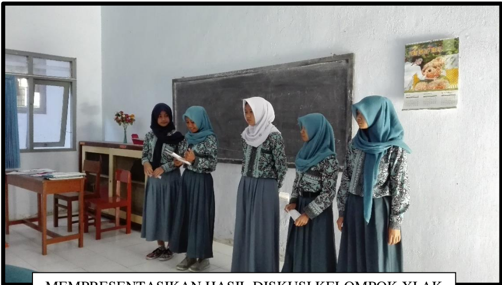
MEMPRESENTASIKAN HASIL DISKUSI KELOMPOK XI AK