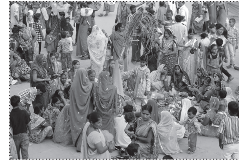
LJUDI U VARANASIJU NA ŠAKTIN DAN. FOTO: FELIPE VERA, 2013.