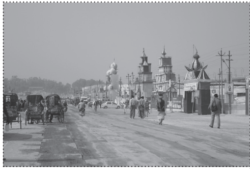
PORTALI U KUMBH MELI.