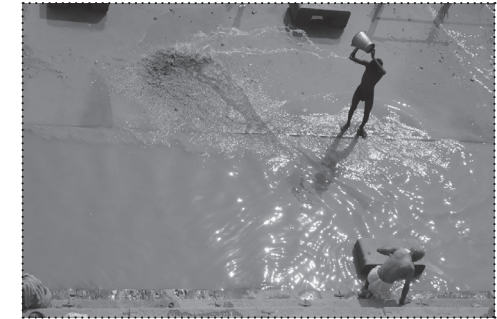
GHATOVI U VARANASIJU TIJEKOM POVLÄČENJA MONSUNA. FOTO: FELIPE VERA, 2013.