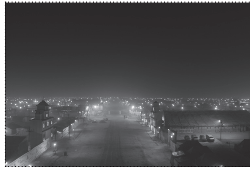
KUMBH NOĆU. FOTO: FELIPE VERA, 2013.