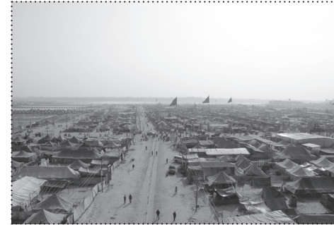
PUT U SANGAM. FOTO: FELIPE VERA, 2013.

Indijske ekologije svetosti mogu nas naučiti kako ponovno uvesti privremenost u urbanistički imaginarij predviđajući prostore nestalnosti. Kurirajući smislene urbane obrede i pozivajući na razmatranje praktičnijih aspekata materijalne privremenosti, dematerijalizacija i rastavljanje postaju važni integralni procesi u projektiranju zgrada i gradova. … Mogli bismo na slučajevje kao što je Kumbh Mela gledati kao na prilike za promišljanje scenarija o gradovima koji, kao nepotpuni i otvoreni sustavi, uključuju različite privremenosti organizirane i uklopljene u njihov materijalni diskurs. Također bismo se mogli složiti da su to primjeri načina na koji je vrijeme u samom srcu urbanog razvoja, kroz artikulaciju smislenih procesa koji se odvijaju različitim tempom u urbanim sustavima i strukturama koje su inače kohezijske. Na razini