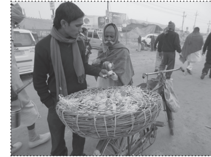
ULIČNE INTERAKCIJE U KJUMBHU.