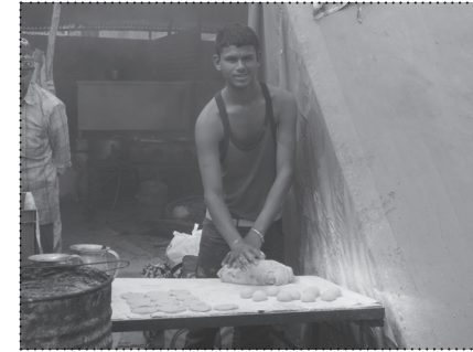
PRIPREMANJE HRANE U NAĞRIJU.