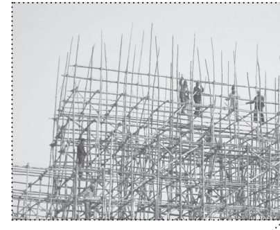
IZGRADNJA KUMBHA.