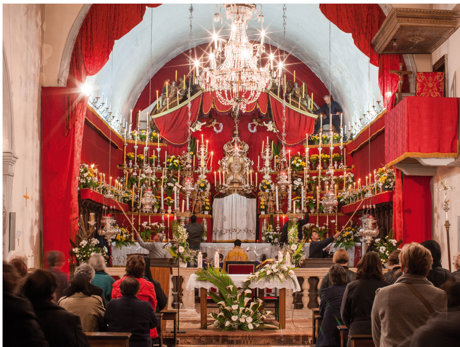
KOMIŽA: Zajednička ura na Cvjetnicu, Veliki ponedjeljak i Veliki utorak