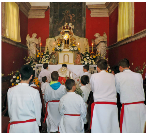
BLATO: Otvaranje kvarantora na Cvjetnicu