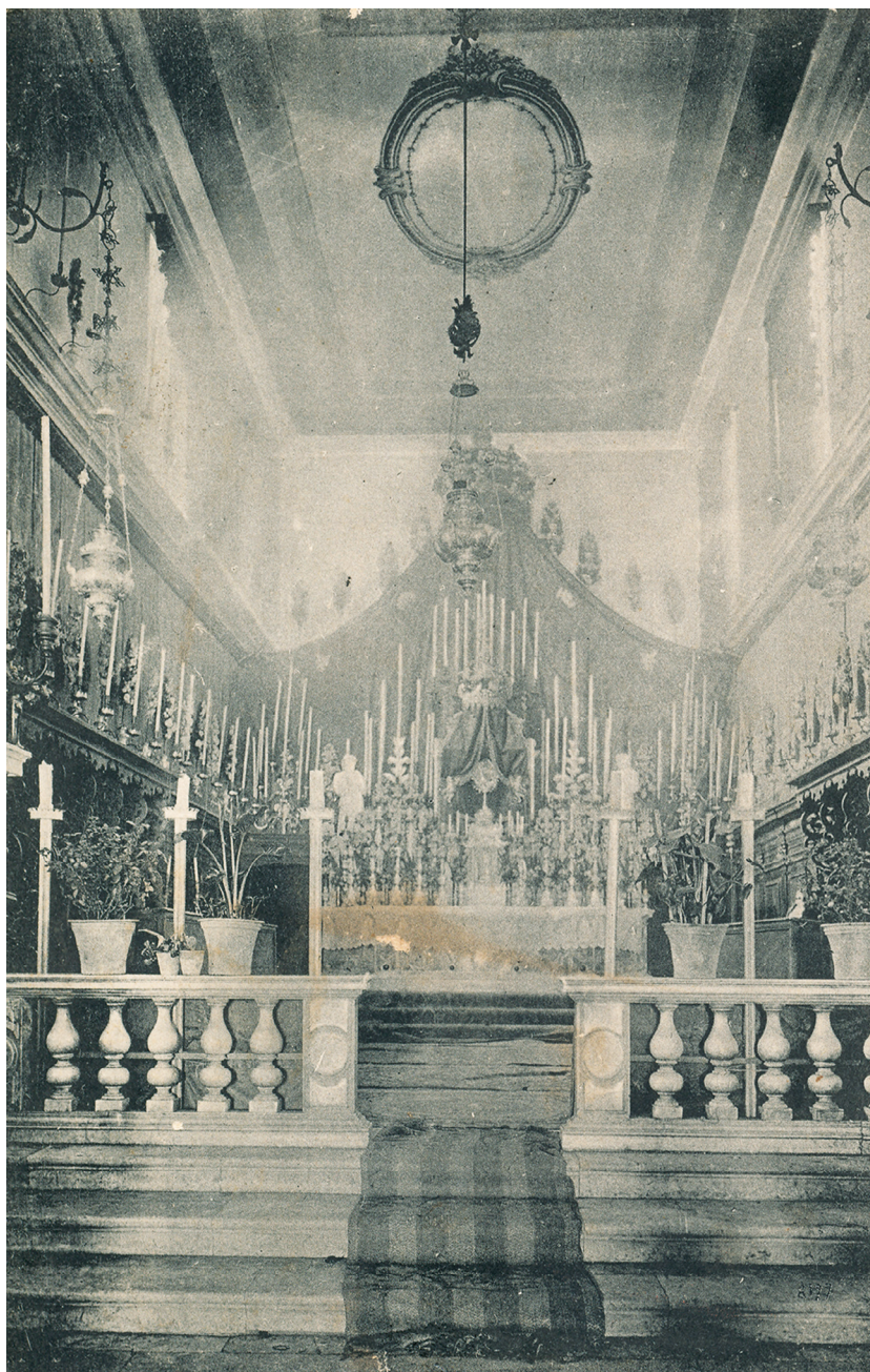
VIS: Kvarantore u župnoj crkvi Uznesenja Marijina