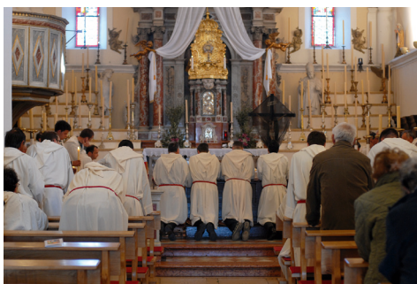
JELSA: Bratimska ura u župnoj crkvi Uznesenja Marijina

U Vrboskoj je ostao naziv bratimska ura za zajedničku popodnevnu pobožnost na kojoj se pjeva Ja se kajem, Uzdasi Isusu te molitva na čast Isusovih rana, a do zabrane procesija postojala je bratimska ura s procesijom iz jedne u drugu crkvu. U Starom Gradu do danas u popodnevним satima postoji dominikanska ura koju animiraju dominikanci, a 50-ih godina su iščezle tri male procesije kojima se iz triju crkava dolazilo obaviti na Cvjetnicu pohod Svetotajstvu u župnu crkvu, što je bio ostatak nekadašnjih pohoda bratovština. U Starom Gradu i Vrboskoj se na zajedničkoj uri pjeva Prosti moj, Bože, Klanjamo ti se, Kriste, Smiluj se meni, Bože te ono što je posvuda uobičajeno za euharistijski blagoslov. U Vrboskoj su Divnoj dakle i Klanjamo ti se, Kriste , iako skladbe Josipa Raffaellija, poprimile pučko glazbeno oblikovanje. U Jelsi se na zajedničkoj uri, osim psalma Smiluj se meni, Bože , pjeva Prijatelji moji i bližnici moji , te Budi hvaljeno po sve vrime .