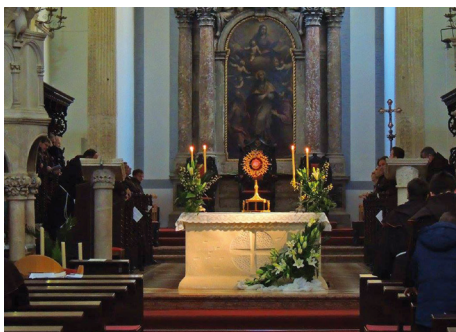
HVAR: Sadašnje kvarantore u Katedrali. Svetotajstvo je izloženo na oltaru prema puku