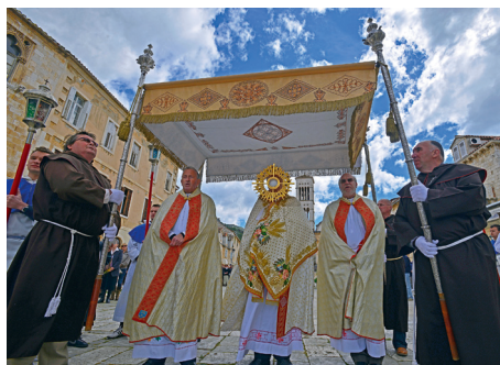
HVAR: Procesija na završetku kvarantora na Veliku srijedu

Velikom tjednu na Visu više ne dolazi posebni propovjednik ( predikatur, predikavac, frotar ), no i na Braču i Hvaru župnici muku muče kako bi našli svećenika koji bi u Velikom tjednu propovijedao i ispovijedao, što će u budućnosti postati „nemoguća misija“. Dakako, dođe li netko čije su propovijedi dosadne ili za domaći ukus promašene, onda nisu rijetki komentari na račun propovijedi i propovjednika, kao i onoga tko ga je doveo, što odgovara tipičnim crtama mediteranskog duha. Danas, koliko mi je poznato, na zajedničku uru klanjanja dolazi sve manji broj mladih ljudi, a prevladavaju župljani srednje i starije životne dobi, posebno ljubitelji tradicijskih napjeva, pa se može reći kako je teško misliti da će ova pobožnost u budućnosti opstati, što je vidljivo iz drugih primjera.