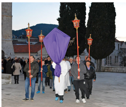
VELA LUKA: Procesija u sklopu zajedničke ure kvarantora