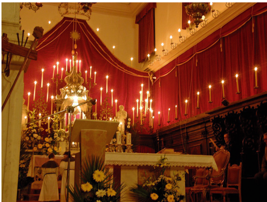
VIS: Kvarantore u župnoj crkvi Uznesenja Marijina