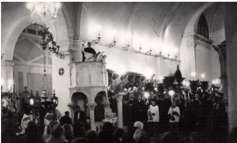
HVAR: Propovijed (fervorin) na Veliki petak u Katedrali

1754. g., a nedvojbeno su bile uvedene mnogo ranije. Po svemu sudeći, u Starom Gradu su uvedene u 18. st., a za Vrbosku točno znamo da su uvedene 1868. g., u vrijeme biskupa Dubokovića. Za razliku od ostalih župa, jedino se u Vrbanju do danas održavaju uz svetkovinu Duhova, odnosno uz naslov župne crkve, što je zabilježeno već početkom 19. st. Danas se kvarantore održavaju u dubrovačkoj katedrali, krčkoj katedrali, Orebiću, Drnišu, iako rijetko u klasičnom obliku.