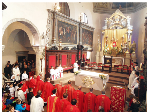
KRK: Otvaranje kvarantora u krčkoj katedrali na Cvjetnicu