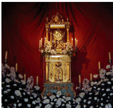
KORČULA: Kvarantore u ex-katedrali sv. Marka

put obavljaju isusovci 1584. g. Iste je godine u Veneciji osnovana i bratovština 40-satnog klanjanja ( emeronitti ) koja je u danima pred Pepelnicu, tj. na vrhuncu karnevala, 40-satnim klanjanjem davala zadovoljštinu za grijeha počinjene u vrijeme karnevala. Iz istih su pobuda prvi put održane u Padovi 1600. g. Međutim, korijeni ove pobožnosti mnogo su stariji i nisu vezani uz Milano. Naslanjaju se na simboliku četrdesetsatnog počinka Kristova tijela u grobu, o čemu je već sv. Augustin govorio u djelu De Trinitate , pa su se uz taj simboličan broj javljale različite molitvene pobožnosti u srednjovjekovnom razdoblju.