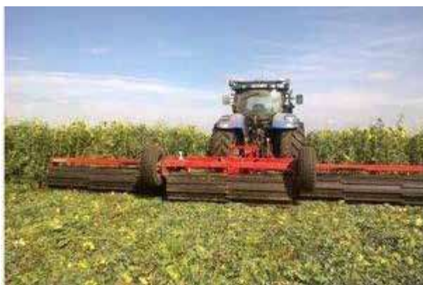
Uništavanje živog malča valjanjem