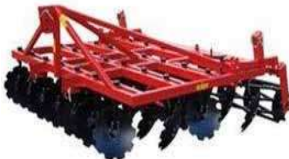
Slika 3. Tanjurača za konzervirajuću obradu tla