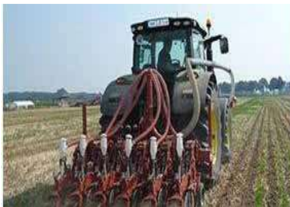
Sjetva nakon obrade traka