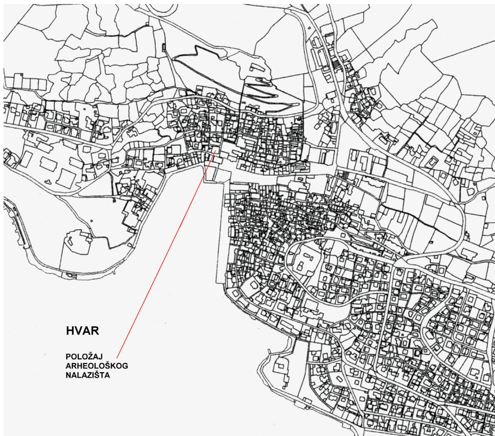
Položaj arheološkog nalazišta

U nastavku donosim kratak opis, te osvrt na nalazište i nalaze, a u prilogu sumaran pregled nalaza.