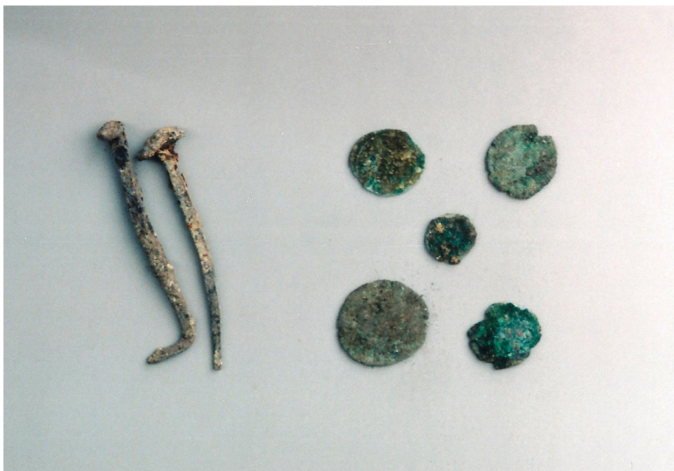
Novčići i bakreni čavli