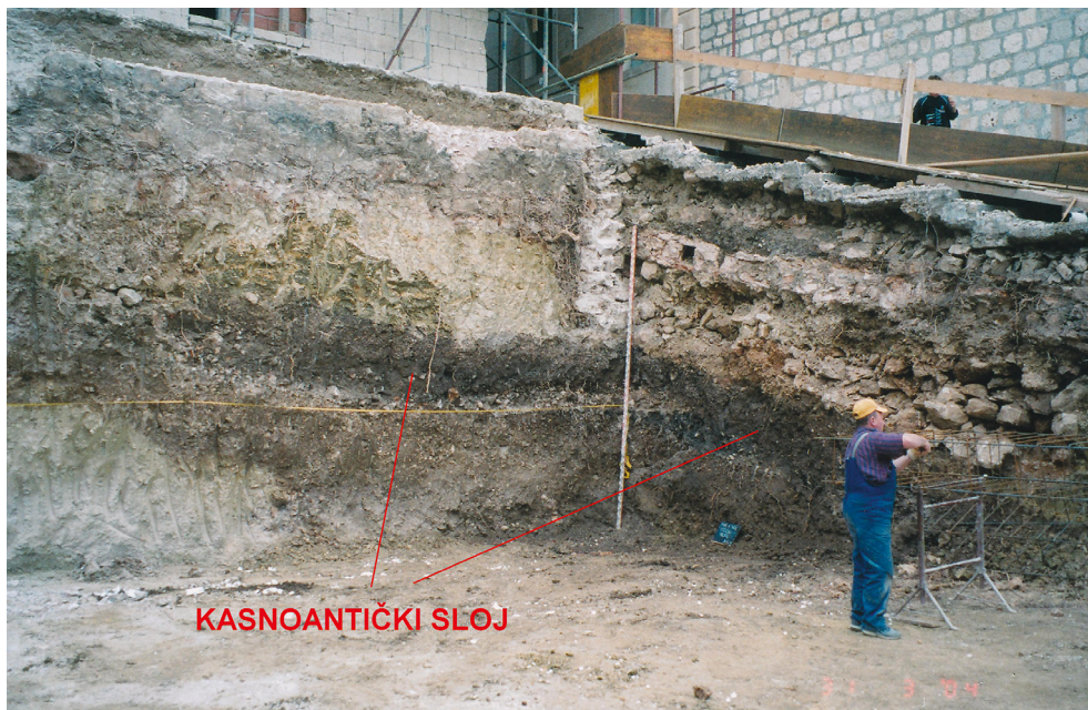
Iskop u vrtu hotela Park