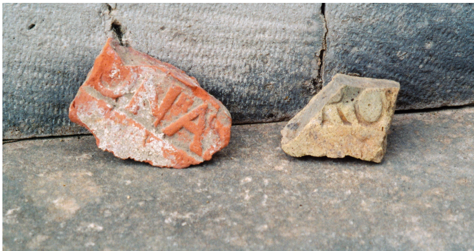
Dva ulomka tegula s pečatima