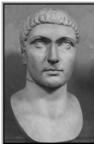
Car Konstantin Veliki (272. - 337.)