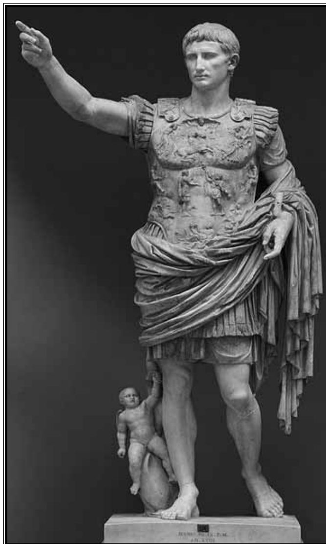
Oktavijan (63.g.pr.Kr. - 14.g.)

Od plemena na području Panonije, kao što se i uočava, najveći otpor pružali su pripadnici keltskog plemena Skordiska. Oni dolaze u sukob s Rimljanima 88. g. pr. Kr. i Rimljani ih na čelu sa Scipionom Azijagenom poražavaju (Domić Kunić, 2006: 90; Hoti, 1992: 135; Matijašić, 2009: 119; Pinterović, 1978: 31). Jedino se A. Mócsy ne slaže s godinom konačnog kraha Skordiska,