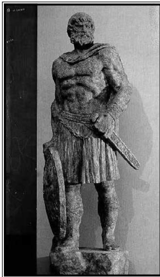
Skulptura Batona desitijatskog

Međutim, među uzrocima Batonova ustanka (6. - 9. g.) ističe se rimsko novačenje i skupljanje nameta, a budući da su Desitijati bili predvodnici dade se zaključiti da su već morali biti podložni Rimu. Jedina mogućnost podjarmljivanja domorodačkih naroda u Bosni jest Tiberijev pohod u Panonskom ratu. Vjerojatno su tada pokoreni Ditioni i Mezeji. Iako je 11. g. pr. Kr. Tiberijev pohod u Panoniji završio i senat je naredio zatvaranje vrata Janova hrama, sukob u Panoniji još nije bio gotov.