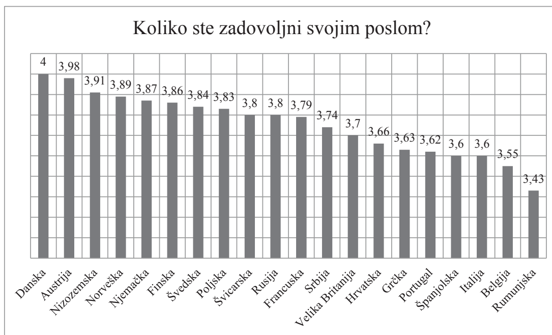
Grafikon 3. Ocjena zadovoljstva poslom komunikacijskih stručnjaka