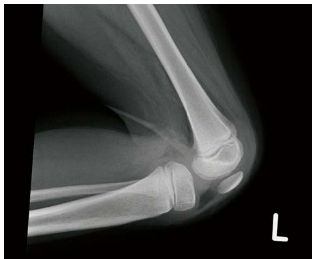
SLIKA 4B. RTG lijevog koljena u LL poziciji (djevojčica M.S. u dobi od 5 god.)