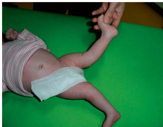
SLIKA 2. Klinički pregled: dislokacija oba koljena (djevojčica M.S., u dobi od 21-og dana)