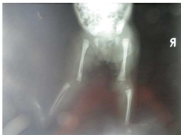
SLIKA 3. RTG prikaz razvojnog poremećaja oba kuka (luksacija) i obostrane kongenitalne dislokacije koljena (djevojčica M.S., u dobi od 10 dana)

Da je prirodna dislokacija koljena rijedak deformitet, potvrđuje i činjenica da većina autora u svojim radovima opisuju mali broj bolesnika, i to retrospektivnom analizom. Tako je Niebauer 1960. opisao 11-ero djece liječene u razdoblju od 1937. do 1958. godine. Liječena su trakcijom, manipulacijom i imobilizacijom. Nekima je u kasnijoj životnoj dobi rekonstruiran prednji križni ligament, a nekima je učinjena plastika tetive quadricepsa. Bolji rezultati su postignuti kod djece kojoj je započeto liječenje nakon rođenja (5). Carlson i