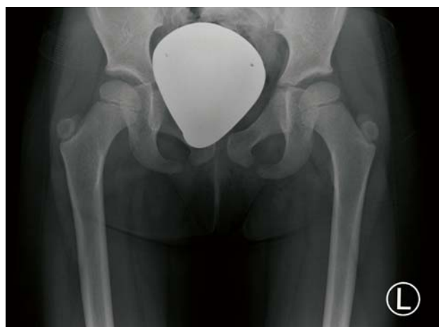
SLIKA 5. RTG oba kuka u AP poziciji (djevojčica M.S. u dobi od 5 god.)

je moguća samo do 60°. Tek nakon trakcije i repozicije kukova i stabilizacije u ortozi bilo je moguće istodobnim redresmanom sadrenim čizmicama potpuno reponirati koljena i dobiti fleksiju od 110°. U odnosu na druge autore sadrenje je trajalo duže (12 tjedana), a potpuna repozicija koljena i izlječenje RPK-a trajalo je do sedmog mjeseca djetetova života.