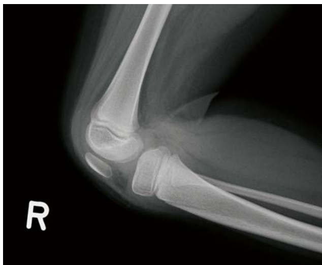
SLIKA 4A. RTG desnog koljena u LL poziciji (M.S. djevojčica u dobi od 5 god.)