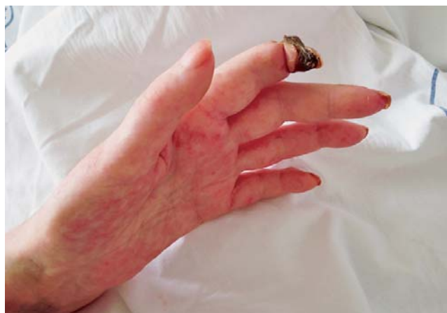
SLIKA 1. Promjene prstiju lijeve šake: teleangiektazije palmarno, sklerodaktilija, suha gangrena distalne falange drugog prsta

FIGURE 1 Changes in the fingers of the left hand: palmar telangiectasia, sclerodactyly, dry gangrene of the distal phalanx of the index finger