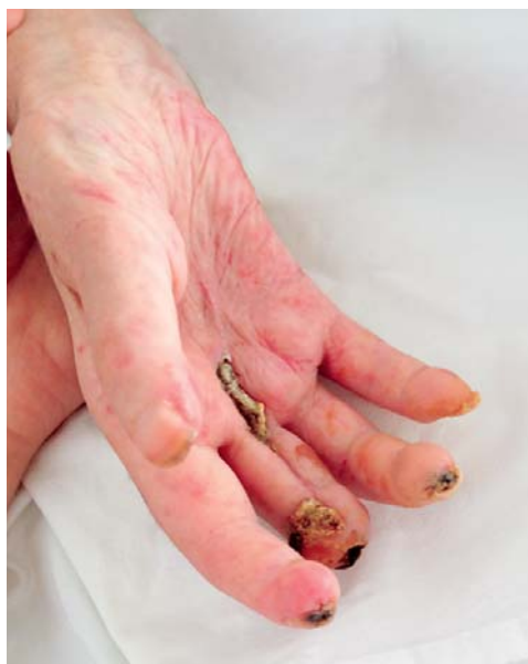
SLIKA 2. Promjene prstiju desne šake: teleangiektazije palmarno, sklerodaktilija, stanje nakon amputacije distalne falange trećeg prsta, digitalne ulceracije vrhova prstiju

FIGURE 1 Changes in the fingers of the left hand: palmar telangiectasia, sclerodactyly, dry gangrene of the distal phalanx of the index finger