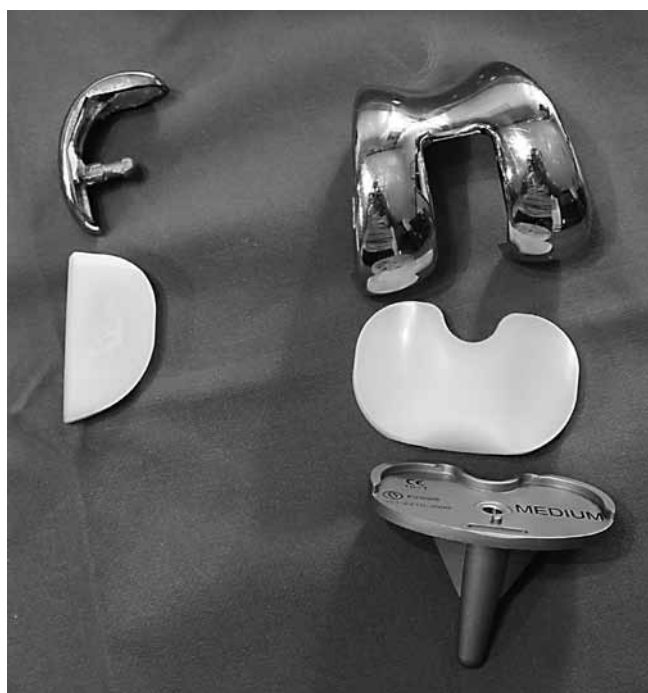
Slika 2. Fotografija cementne djelomične i potpune endoproteze koljena Figure 2 Photo of unicompartmental and total knee arthroplasty