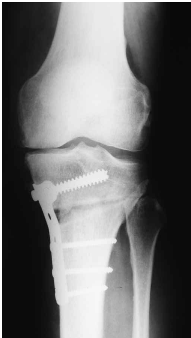
Slika 3. RTG snimka korektivne osteotomije proksimalne tibije Figure 3 Plain radiography of corrective osteotomy of proximal tibia

cementni dizajn endoproteze koljena. U posljednje se vrijeme na tržište probijaju i bescementne endoproteze koljena, ali za sada sa slabijim rezultatima. Osnovni preduvjet za dugo preživljenje endoproteze jest uspostava dobro balansiranoga koljena i neutralne mehaničke osovine donjeg ekstremiteta. Primijećeni su nešto slabiji rezultati pri ugradnji TEP koljena u osoba mlađih od 55 godina, što se tumači povišenom fizičkom aktivnošću (11). Endoproteze su kategorizirane po stupnju povezanosti, odnosno sapetosti. Dije se na nesapete koje se rutinski koriste tijekom operacija jednostavnih OA i mogu biti endoproteze koje čuvaju ili koje žrtvuju stražnju ukrženu svezu. Djelomično sapete endoproteze se koriste u bolesnika s insuficijencijom mekotkivnih stabilizatora zgloba, ponajprije kolateralnih ligamenata. Sapete ili šarnirske proteze sastoje se od femoralne i tibijalne komponente koje su međusobno povezane (najčešće vijkom) i češće se koriste u revizijama, dok se kod primarnih operacijskih zahvata koriste za izrazito nestabilna koljena u svim smjerovima. Iako sapetost povećava inherentnu stabilnost endoproteze, ona izlaže implantate povećanim silama što dovodi u konačnici i do bržeg