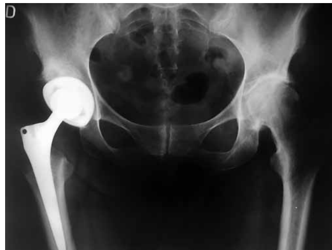
Slika 4. RTG snimka bescementne potpune endoproteze kuka Figure 4 Plain radiography of non-cemented total hip arthroplasty

OA kuka je bolest koja se javlja u bolesnika iznad 55 godina (1). Karakterizira je propadanje zglobne hrskavice, ali promjene su vidljive i u sinoviji, kapsuli i subhondralnoj kosti. Dijagnoza primarnog osteoartritisa kuka postavlja se nakon isključivanja stanja kao što su avaskularna nekroza glave femura, trauma, septički artritis, Pagetova bolest, reumatoidni artritis, displazija kuka, epifizeoliza glave bedrene kosti, Legg-Calve-Perthesova bolest itd. U europskoj populaciji OA kuka se pojavljuje kod 3 – 6 % pučanstva, a izvan Europe znatno je rjeđi s prevalencijom od oko 1 % (20). Bolesnici se tipično žale na bolove u kuku, ali katkad i koljenu, smanjen opseg pokreta, pogotovo unutrašnje rotacije koja je prva zahvaćena u ranim stadijima bolesti, te na šepanje uz smanjenje hodne pruge. Tijekom kliničkog pregleda ustanovljuje se smanjenje opsega pokreta u kuku, bolnost pri izvođenju pokreta te često skraćivanje zahvaćenoga donjeg ekstremiteta. Često su pozitivni