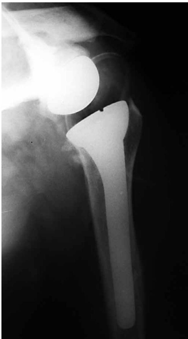
Slika 7. RTG snimka reverzne potpune endoproteze ramena