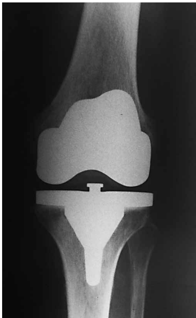
Slika 1. RTG snimka cementne potpune endoproteze koljena Figure 1 Plain radiography of cemented total knee arthroplasty