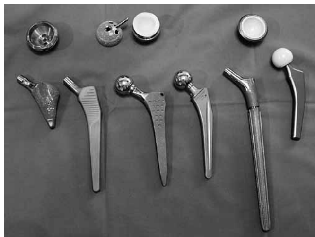
Slika 5. Fotografija različitih modela potpune endoproteze kuka

Figure 5 Photo of the different models of total hip arthroplasty