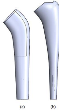
Şekil 2. Çalışmada kullanılan a) Charnley ve b) Hipokrat protezi çimento modeli