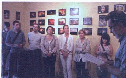
Un moment de la presentació de l'exposició.

GIRONA ACULL LES IMATGES DEL PREMI CARLES RAHOLA. La seu de la demarcació de Girona del Col·legi de Periodistes acull l'exposició "Quinze mirades a dotze mesos", que aplega una selecció de les 147 imatges que es van presentar a la cinquena edició del premi Carles Rahola de Comunicació Local.