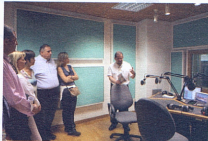
El grup durant una visita a Ràdio Vaticà.

que tindrà lloc a l'octubre. El programa ja té confirmada l'audiència amb el papa Francesc, l'1 d'octubre, així com una trobada informal amb l'ambaixador espanyol a Roma.