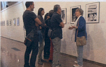
Biarnès durant una visita guiada a la mostra.

EXPOSICIÓ DE JOANA BIARNÈS, PIONERA DEL FOTOPERIODISME. La primera dona del fotoperiodisme a Espanya, la terrassenca Joana Biarnès, de 79 anys, inaugura la primera exposició individual que recull el treball realitzat entre els anys 1960 i 1980. L'exposició reuneix més de 70 fotografies en blanc i negre relatives als primers anys com a fotògrafa de premsa. Durant la inauguració, Biarnès ha anunciat la donació de les fotografies del seu pare, fotògraf esportiu, a l'Ajuntament de Terrassa.