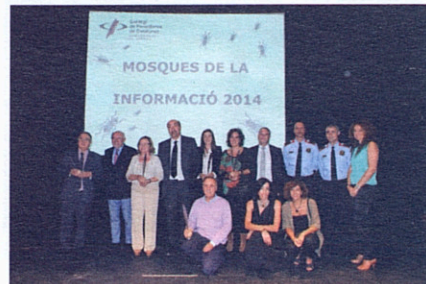
Foto de família dels diferents guardonats.