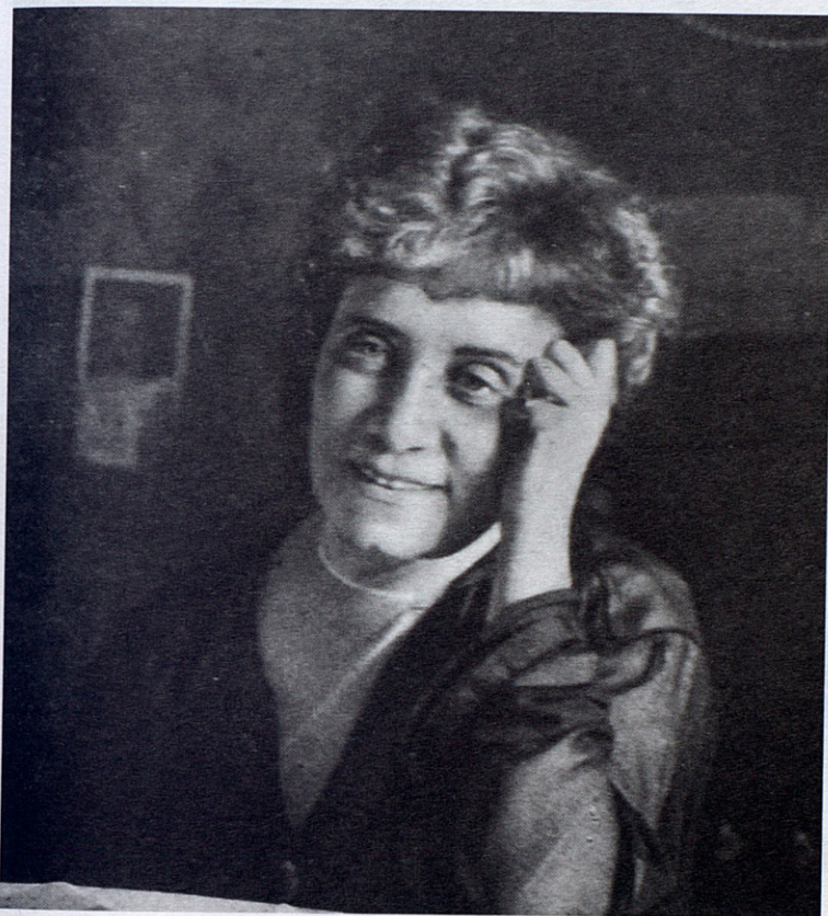
A la primera pàgina, Margaret Fuller. En aquesta pàgina, a sota aquestes línies, Sofia Casanovas. A dalt a la dreta, Carmen de Burgos. A baix, Mary Roberts Rinehart.