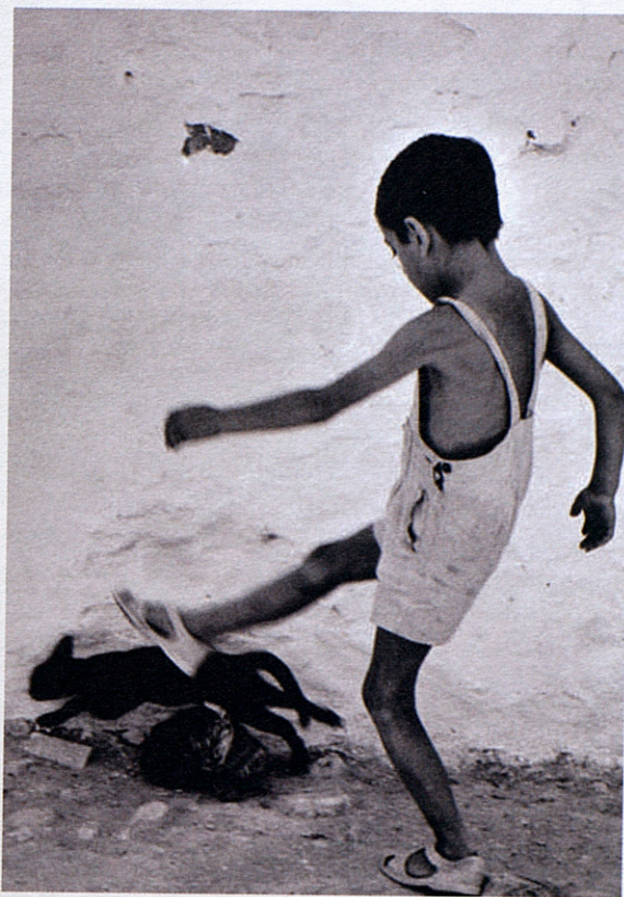
A dalt a l'esquerra, la model i dissenyadora Elsa Peretti al Tiffany's el 1966. A la dreta, membres de la Guàrdia civil amb unes noies a Cadaqués al 1962. A baix a l'esquerra, una imatge de la Mancha el 1961. A sobre d'aquestes línies, un nen a Eivissa el 1954.