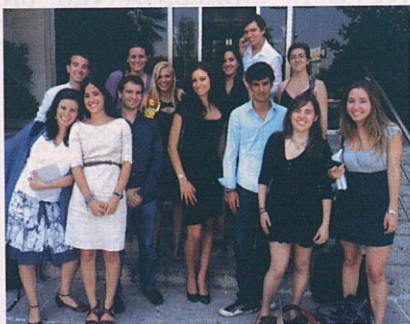
Foto dels estudiants guardonats

ANTENA 3 RECONeix EL TREBALL DE PERIODISTES DE LA UPF. Un equip d'estudiants de Periodisme de la Universitat Pompeu Fabra queda guanyador ex aequo amb la Universitat de Navarra del "Proyecto Mañana" una iniciativa d'Antena 3 per dissenyar els informatius del futur. En el projecte han participat les millors facultats de comunicació de l'Estat espanyol. El contingut dels treballs a concurs estava basat en les notícies generades el 20 de maig i sobre aquestes aportar noves idees i mètodes en la presentació de les notícies.