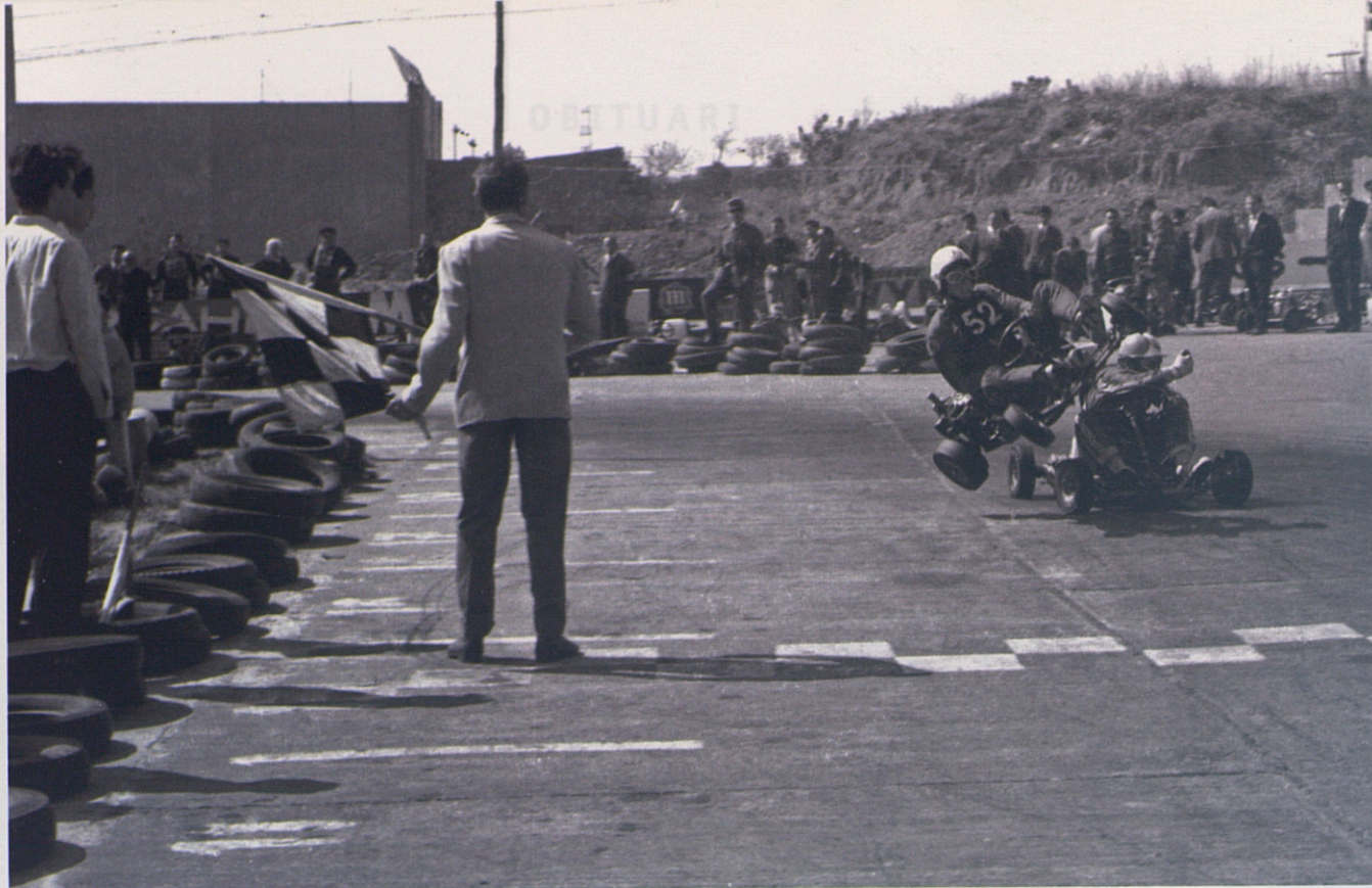
Un petit incident en una cursa de karts durant la dècada dels anys seixanta. Alguersuari va cobrir un bon nombre d'esports.

en el temps, però, mai, mai, mai, van heretar-ne l'olfacte. Perquè era un olfacte de gos caçador, de terrassà, de vidvor. De "caçavides".